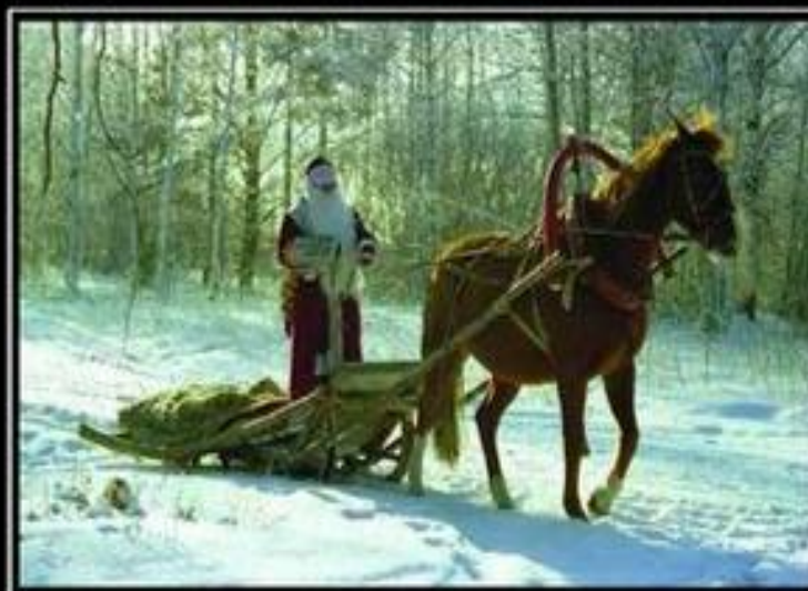
Это Дедушка Мороз он из России