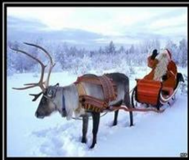
это САНТА Он из Америки.