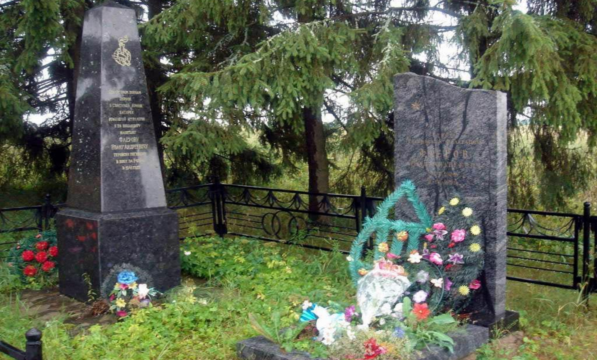
Памятник Ивану Андреевичу Флерову