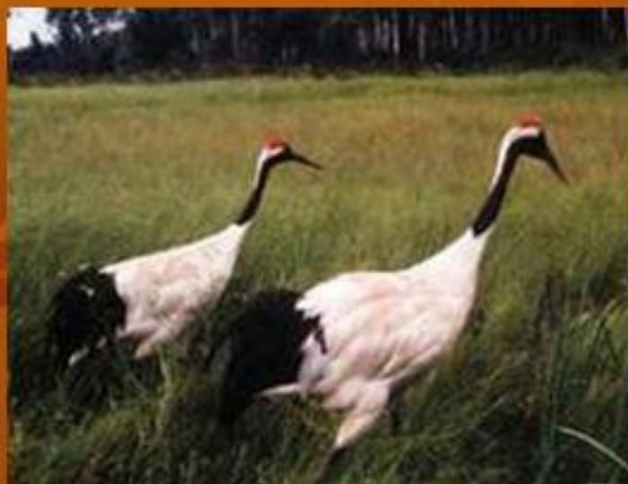
Журавли летят клином