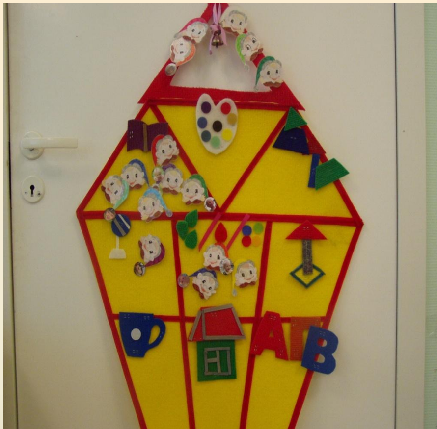
«Доска выбора» в 1-й младшей группе