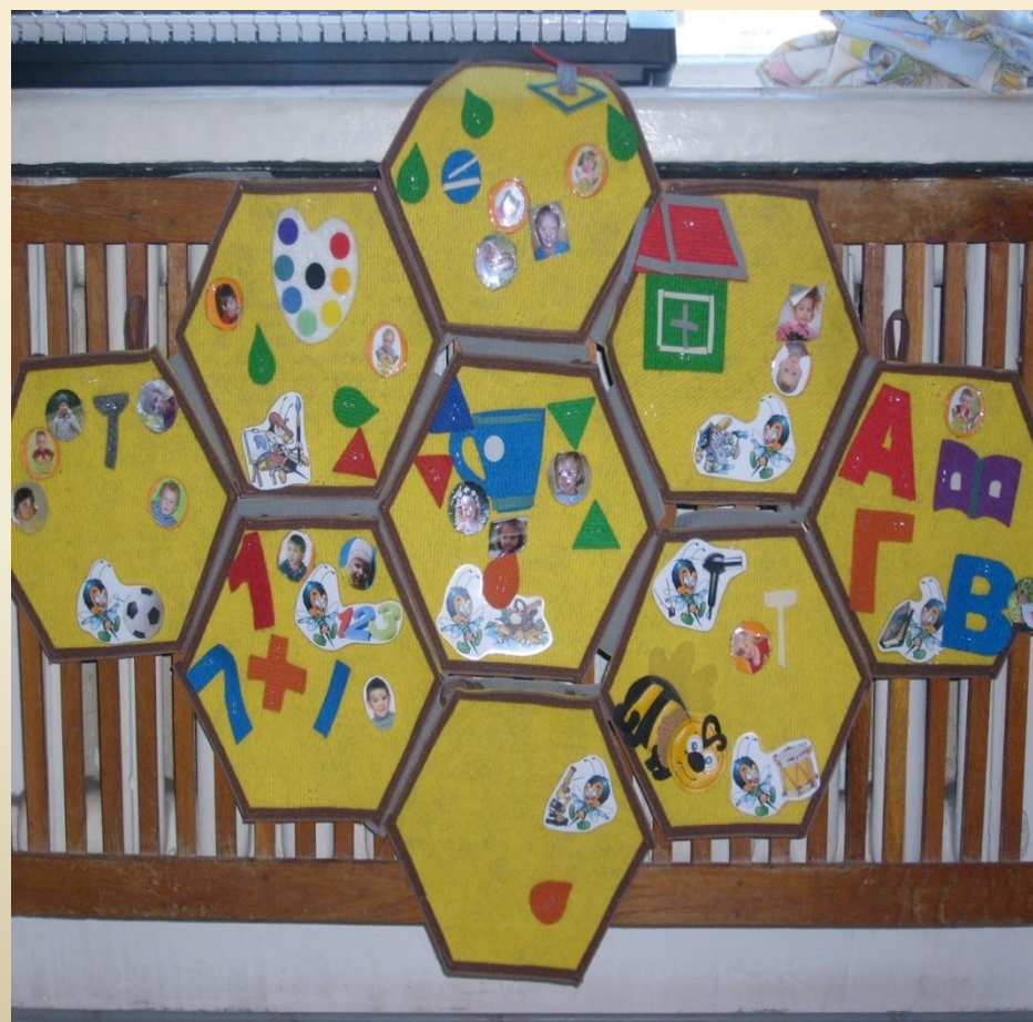
«Доска выбора» в младше-средней группе