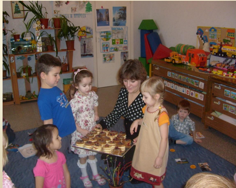
Второй (итоговый) круг в младше-средней группе