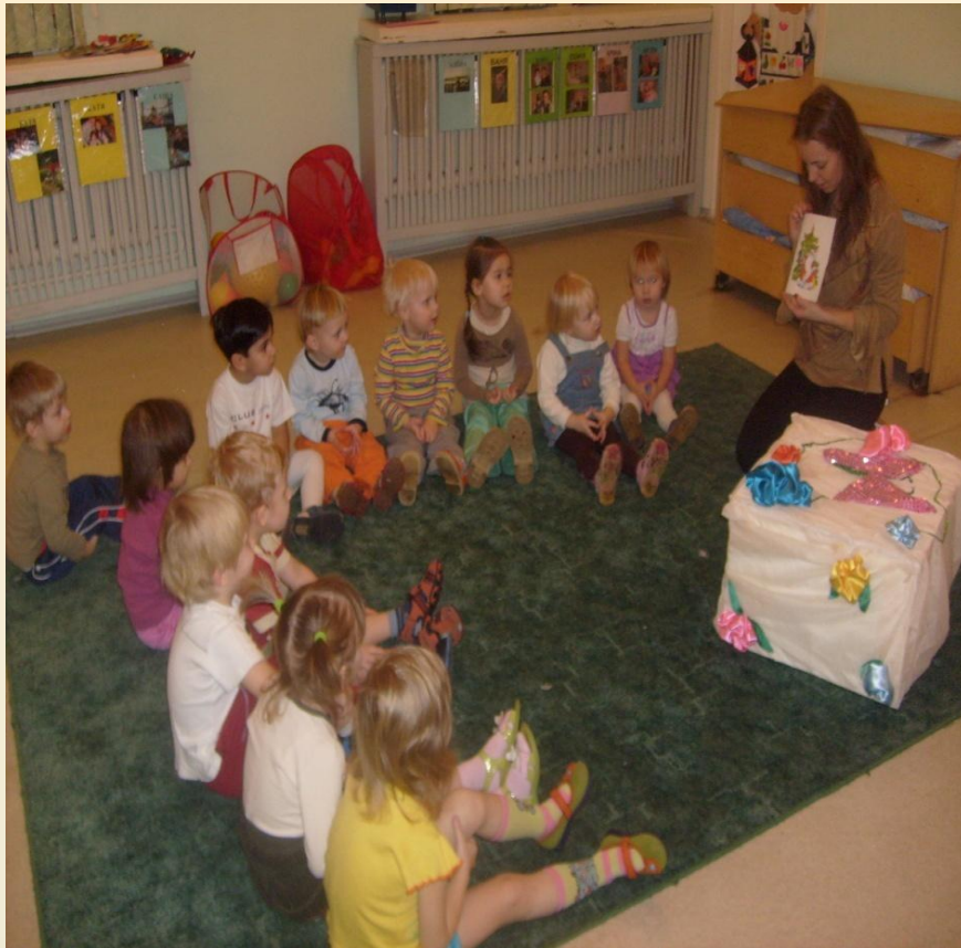
Первый утренний круг в младше-средней группе