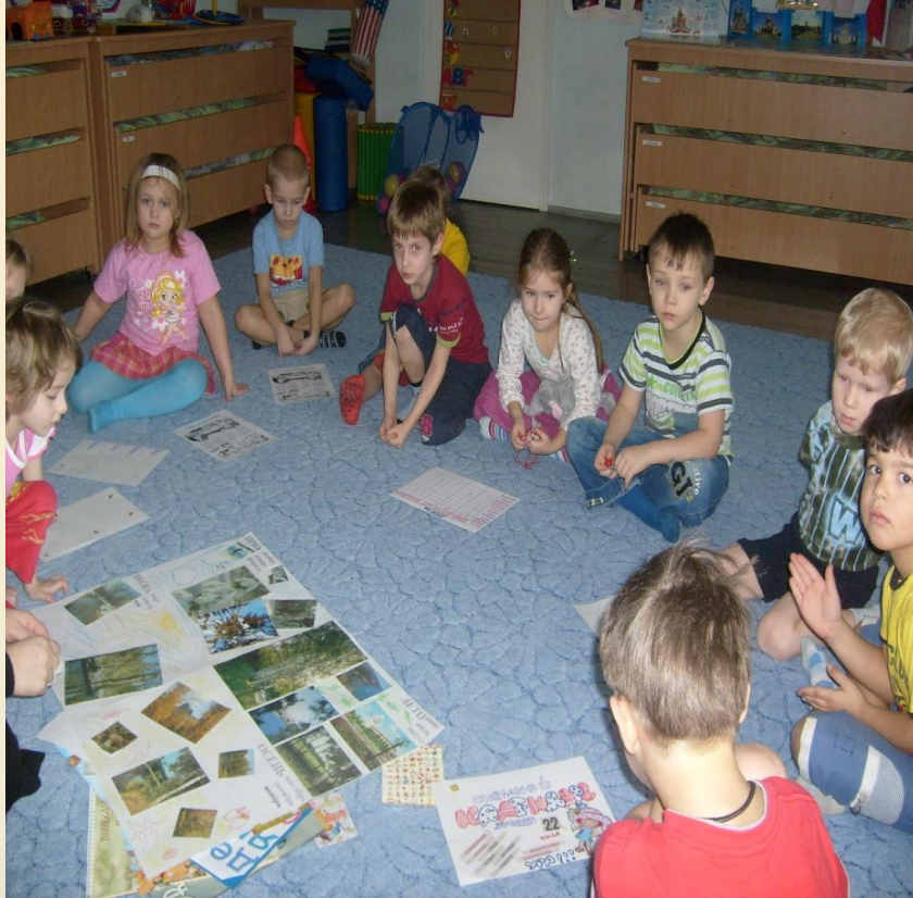
Второй (итоговый) круг в старшей подготовительной группе