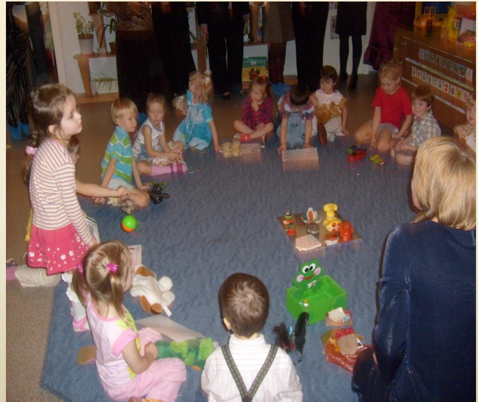
Первый утренний круг в 1-й младшей группе