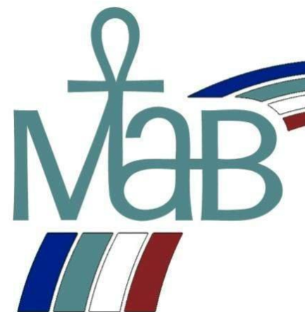
Международная программа ЮНЕСКО «Человек и биосфера».