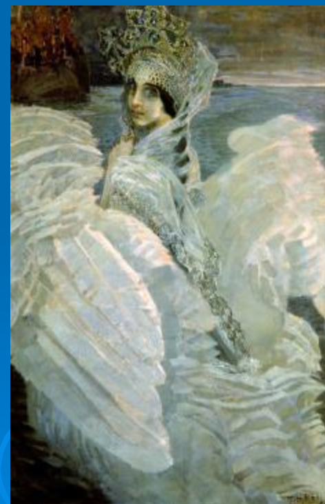
Михаил Врубель «Царевна-Лебедь»