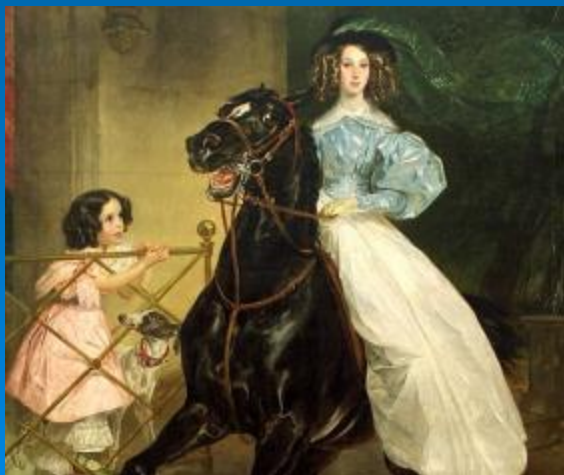
Карл Брюллов «Всадница»