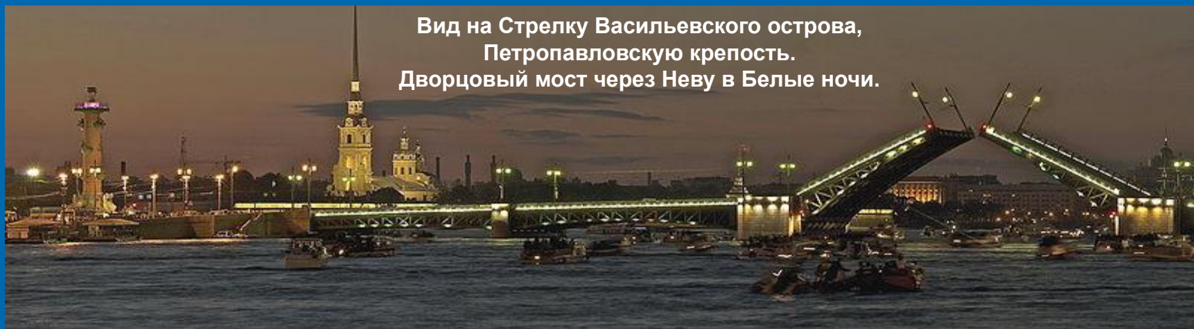
Вид на Стрелку Васильевского острова, Петропавловскую крепость. Дворцовый мост через Неву в Белые ночи.

Дворцовый мост – разводной чугунный мост через реку Неву. Соединяет центральную часть города и Васильевский остров. Назван в честь Зимнего Дворца Русских императоров.