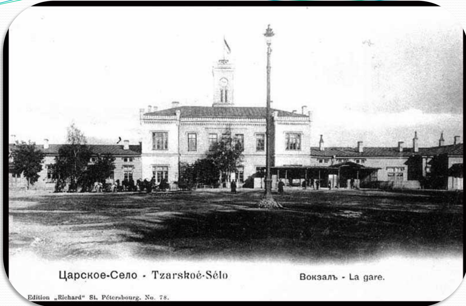
Фото Привокзальной площади и улицы Широкой

I вокзал – октябрь 1837 года (арх. Гаспар Фоссоти)