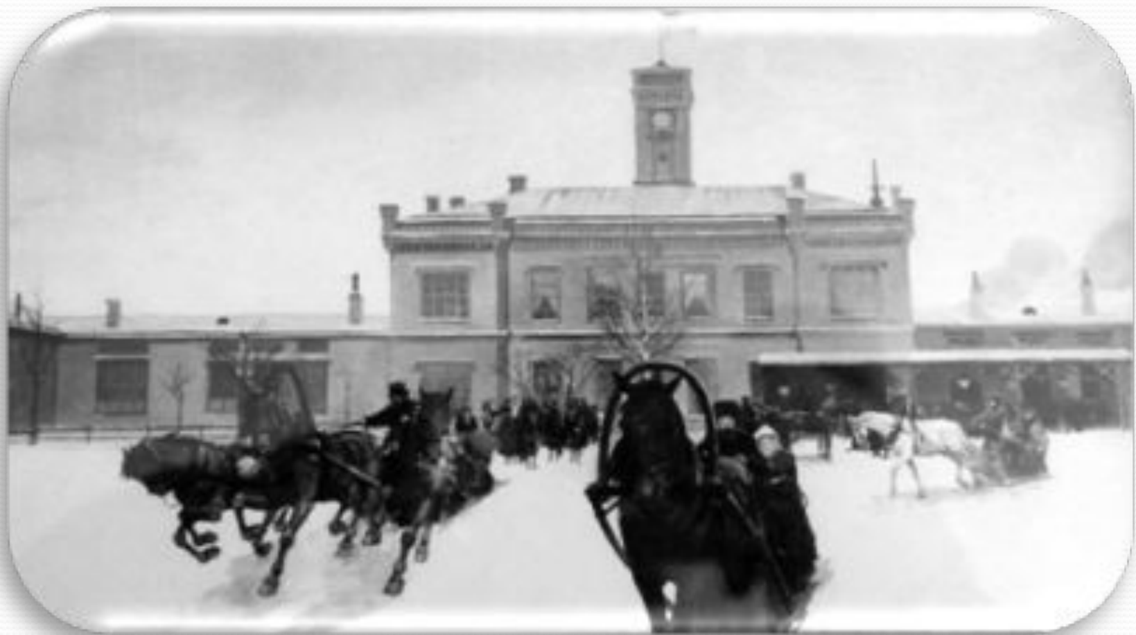
II вокзал – 1849-1852 гг. (арх.К.Л.Тон)