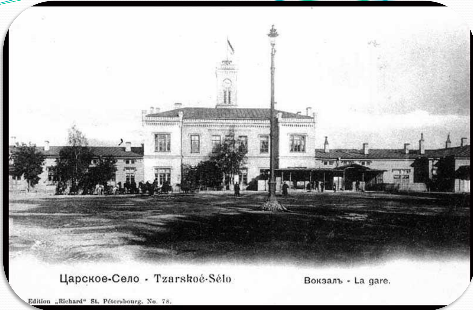
Царское-Село - Tzarskoë-Sélo