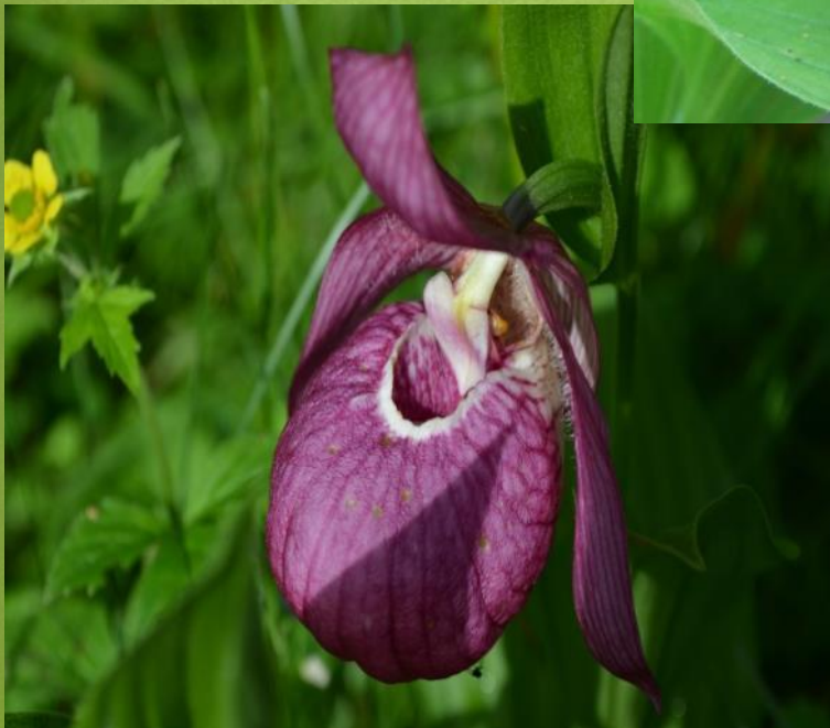
Венерин башмачок обыкновенный