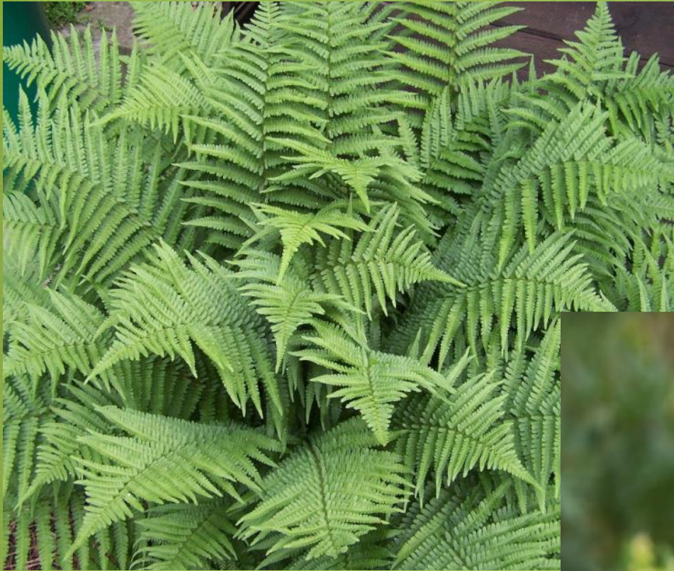
Папоротник щитовник мужской