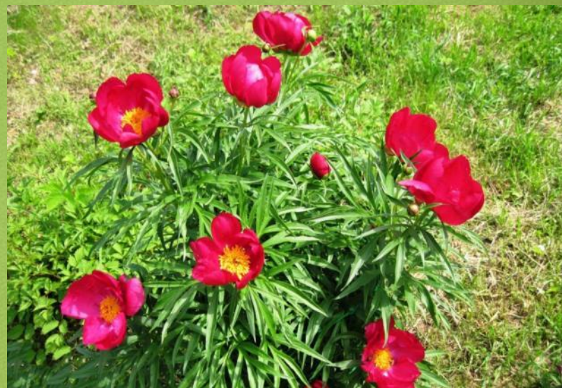
Пион марьин корень