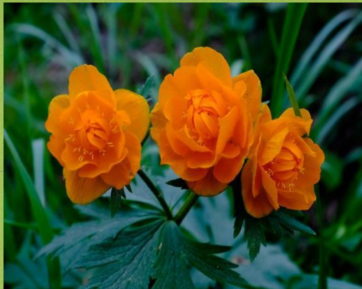
Купальница азиатская (огоньки)