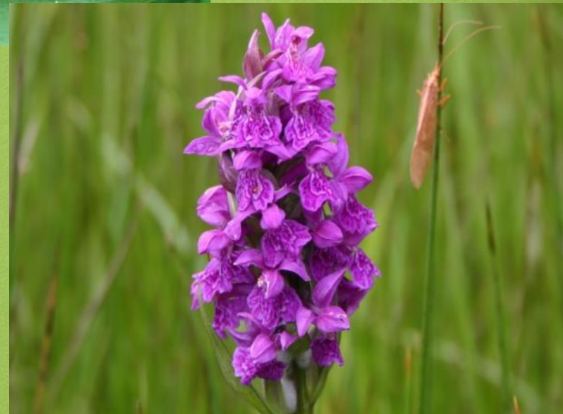
Пальцекорни к балтийский