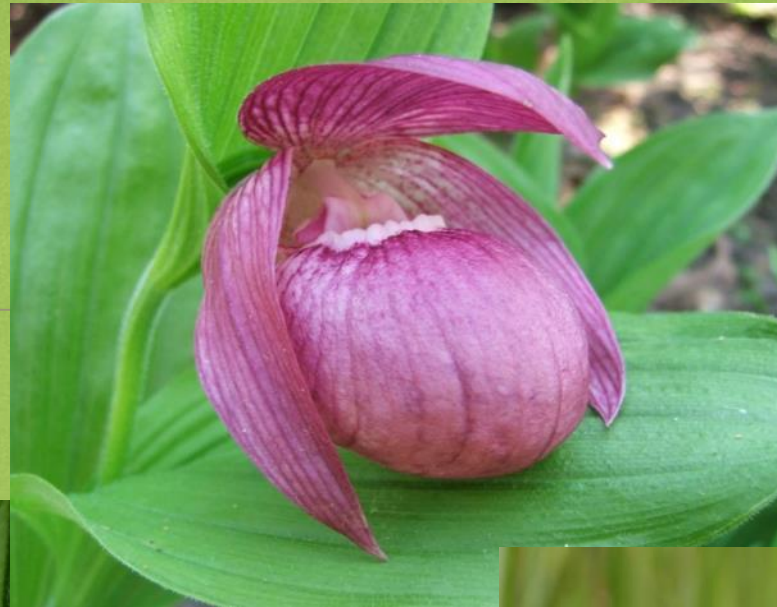
Венерин башмачок крупноцветковый