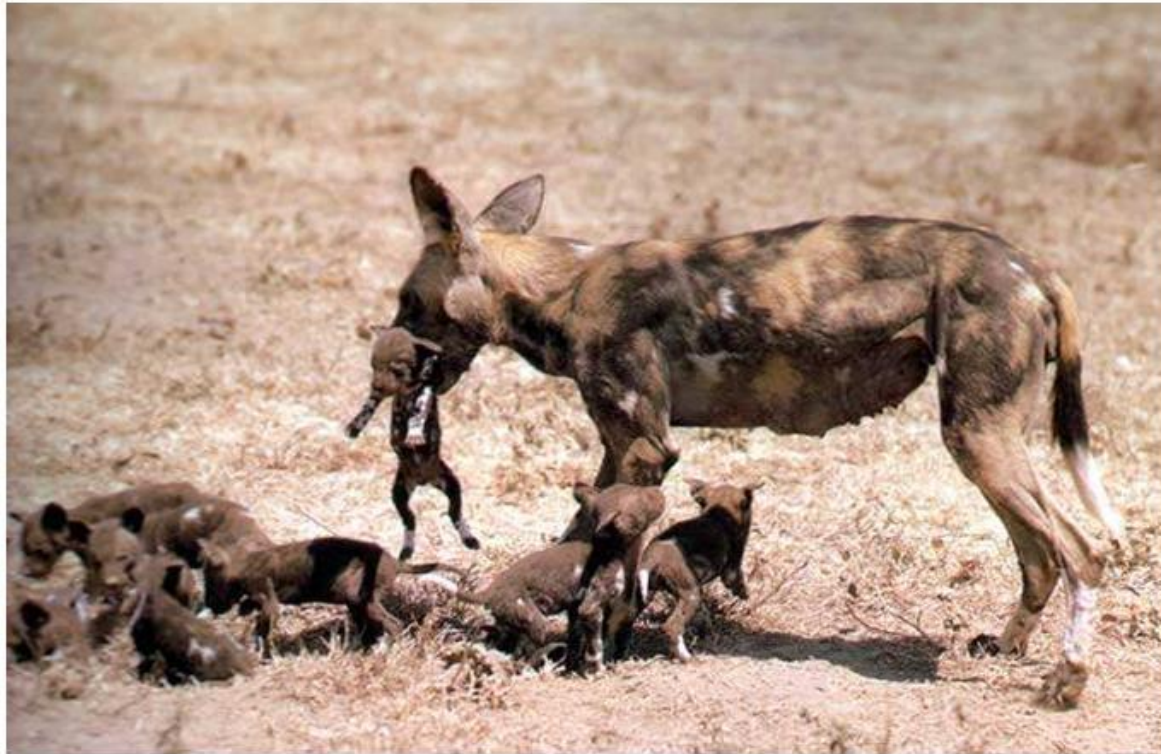
Охотничья собака с щенятами