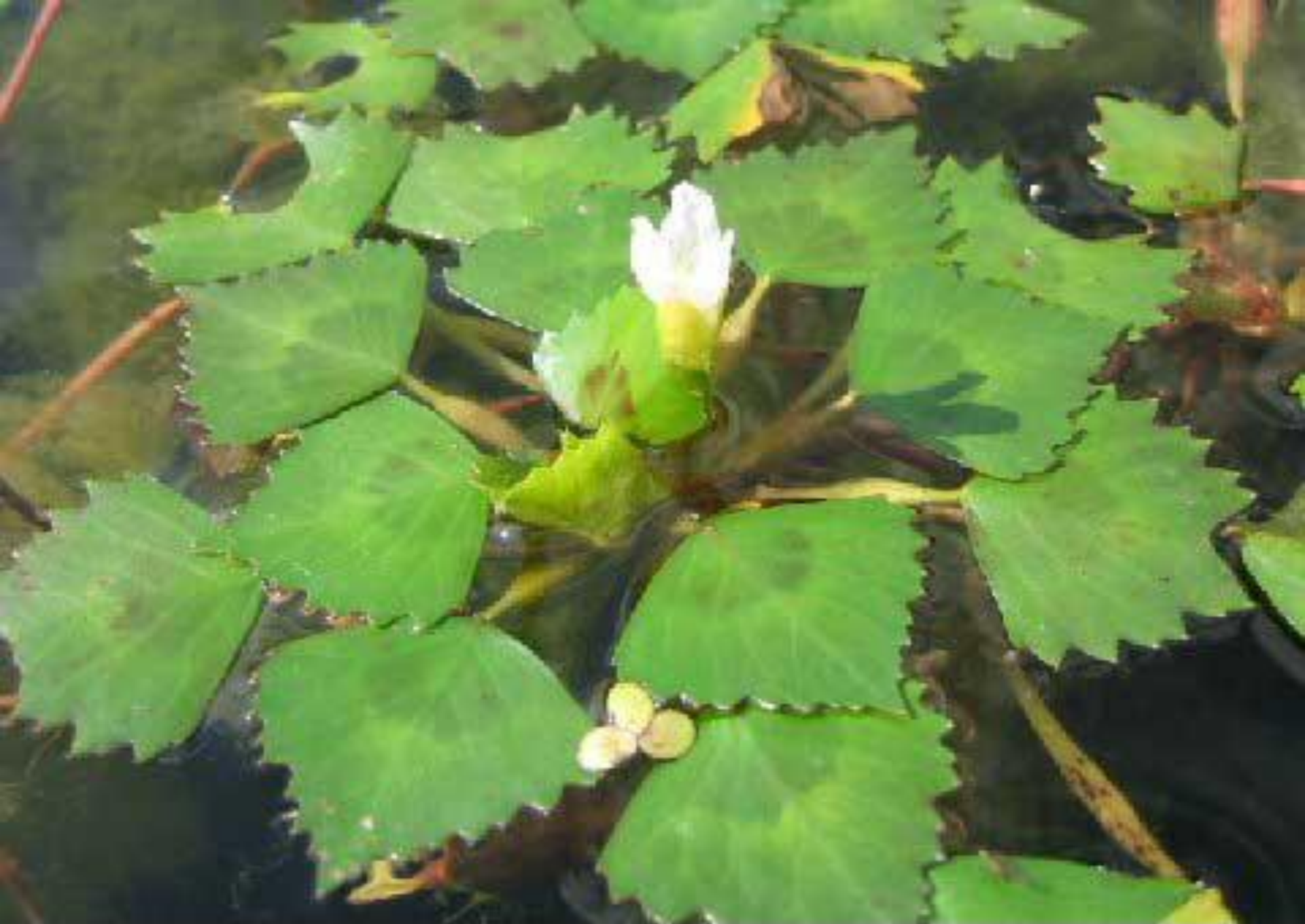
Водяной орех - Najas natans