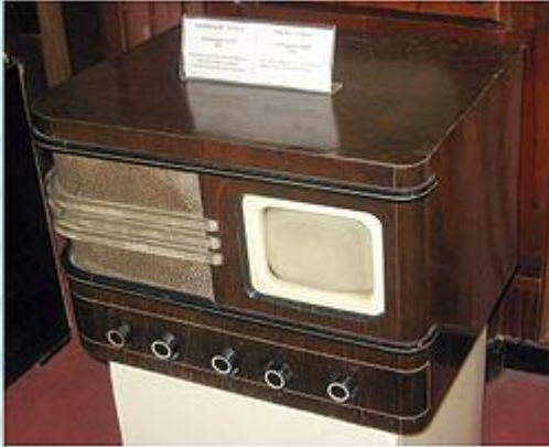
Телевизор 1939 года