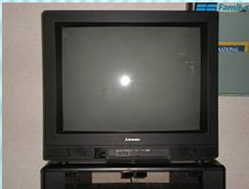
Телевизор 1980 - 90 -х