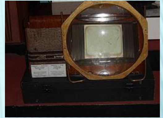
Телевизор 1949 года