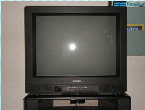
Телевизор 1980 - 90 -х