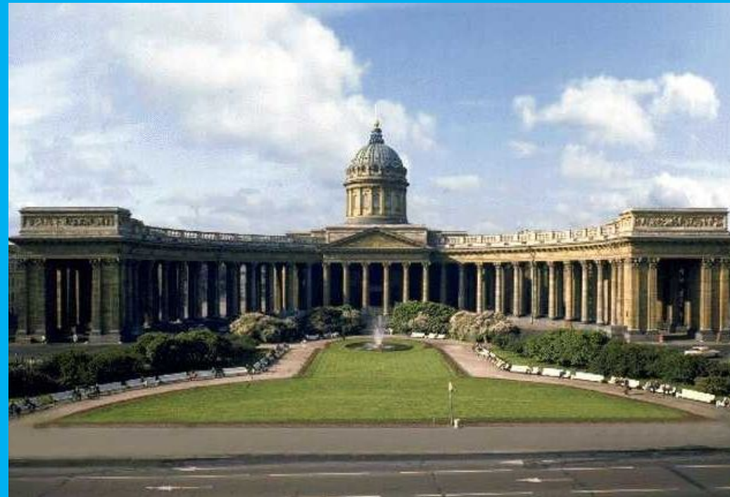
Казанский собор (Санкт-Петербург)