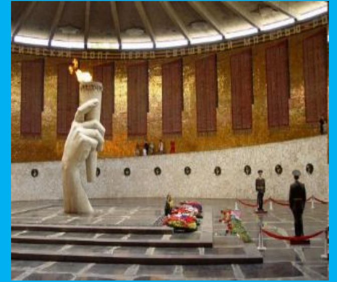
Мамаев курган (Волгоград)