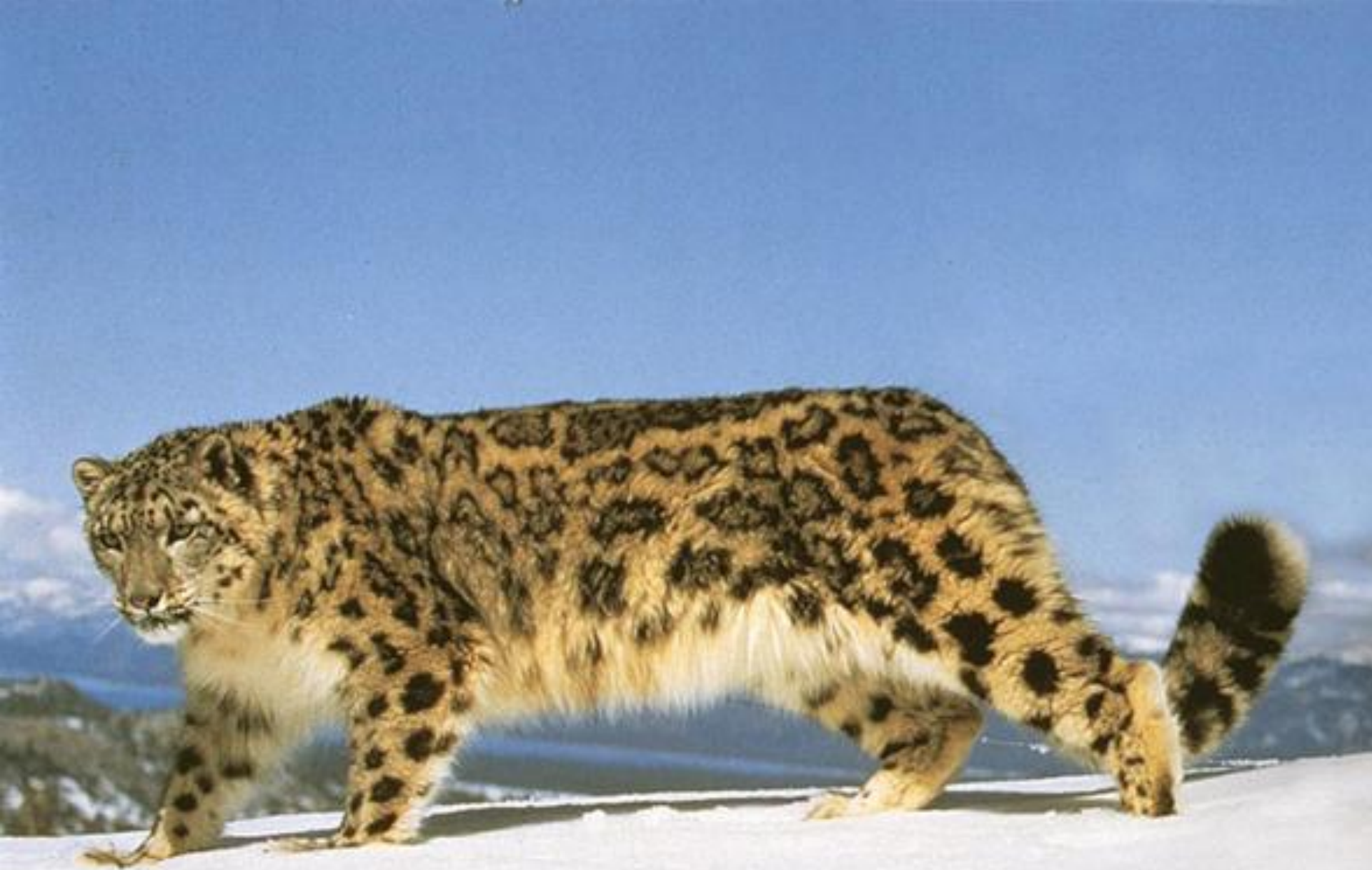
Снежный барс (Ирбис)