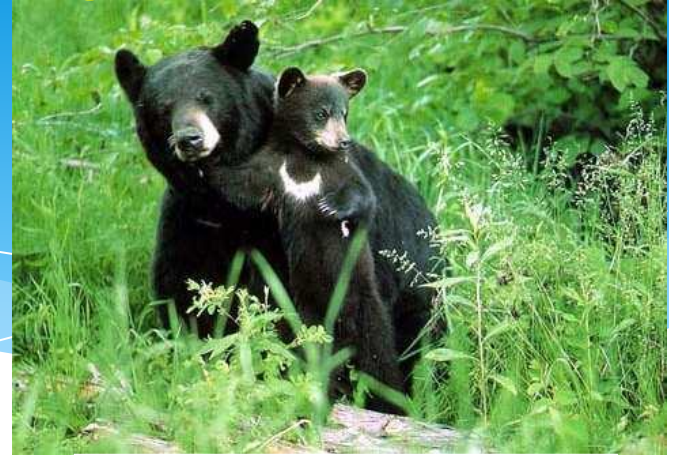
Бело грудый медведь

Из птиц в Японии встречается ласточка, кукушка, воробей, дрозд, утка, цапля, лебедь, бекас, альбатрос, журавль, дятел, голубь, фазан, а из певчих - соловей и снегирь.