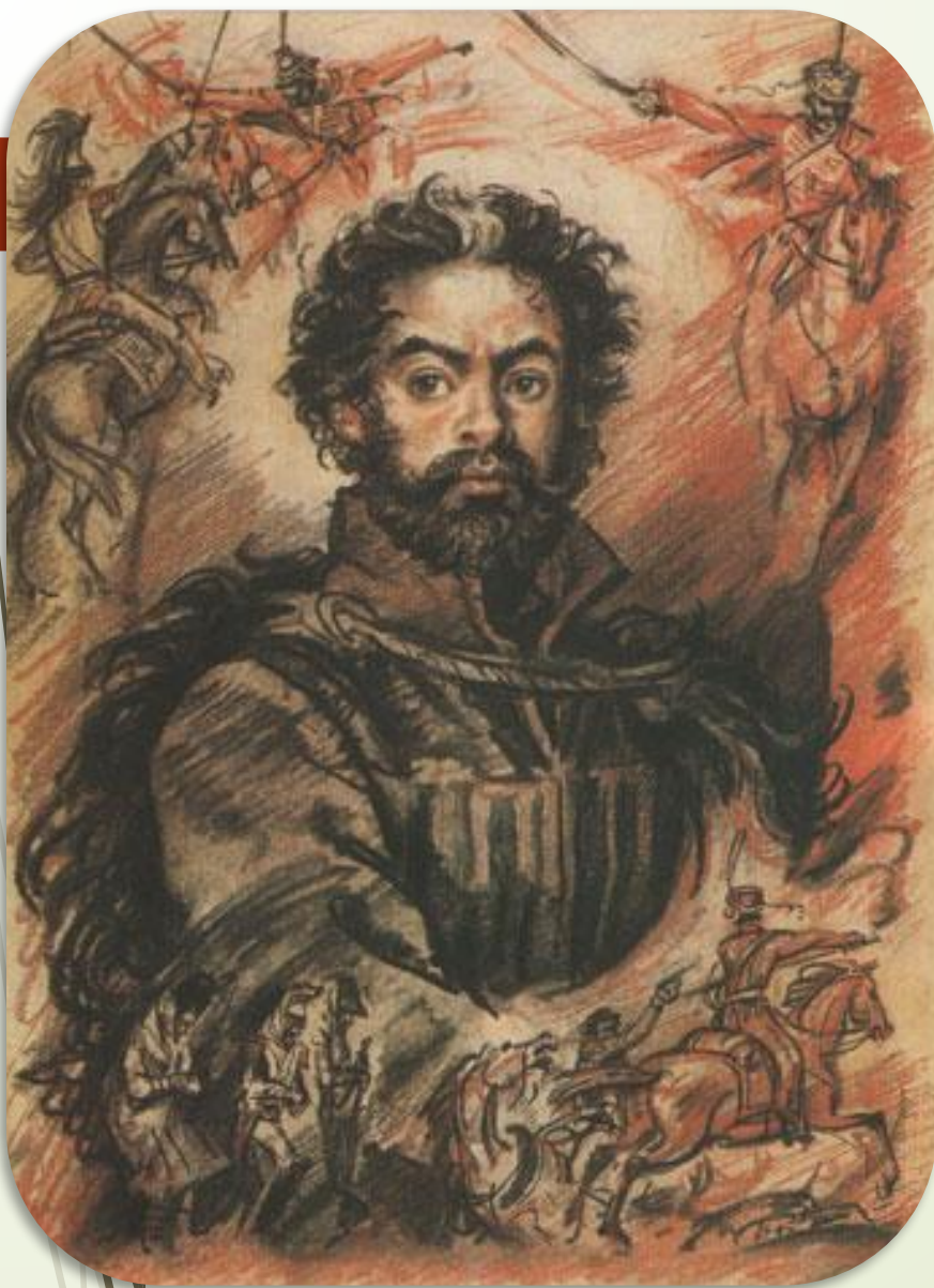
Денис Васильевич Давыдов