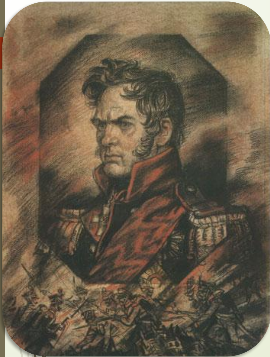
Алексей Петрович Ермолов