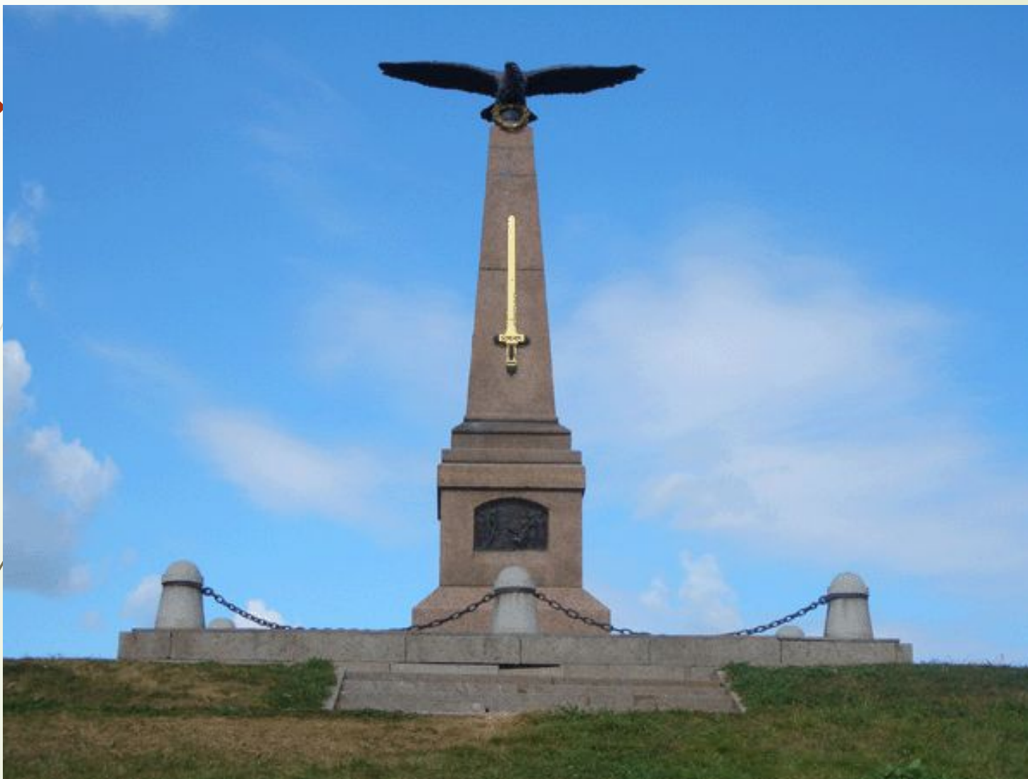
Памятник русским воинам на Бородинском поле в Московской области.