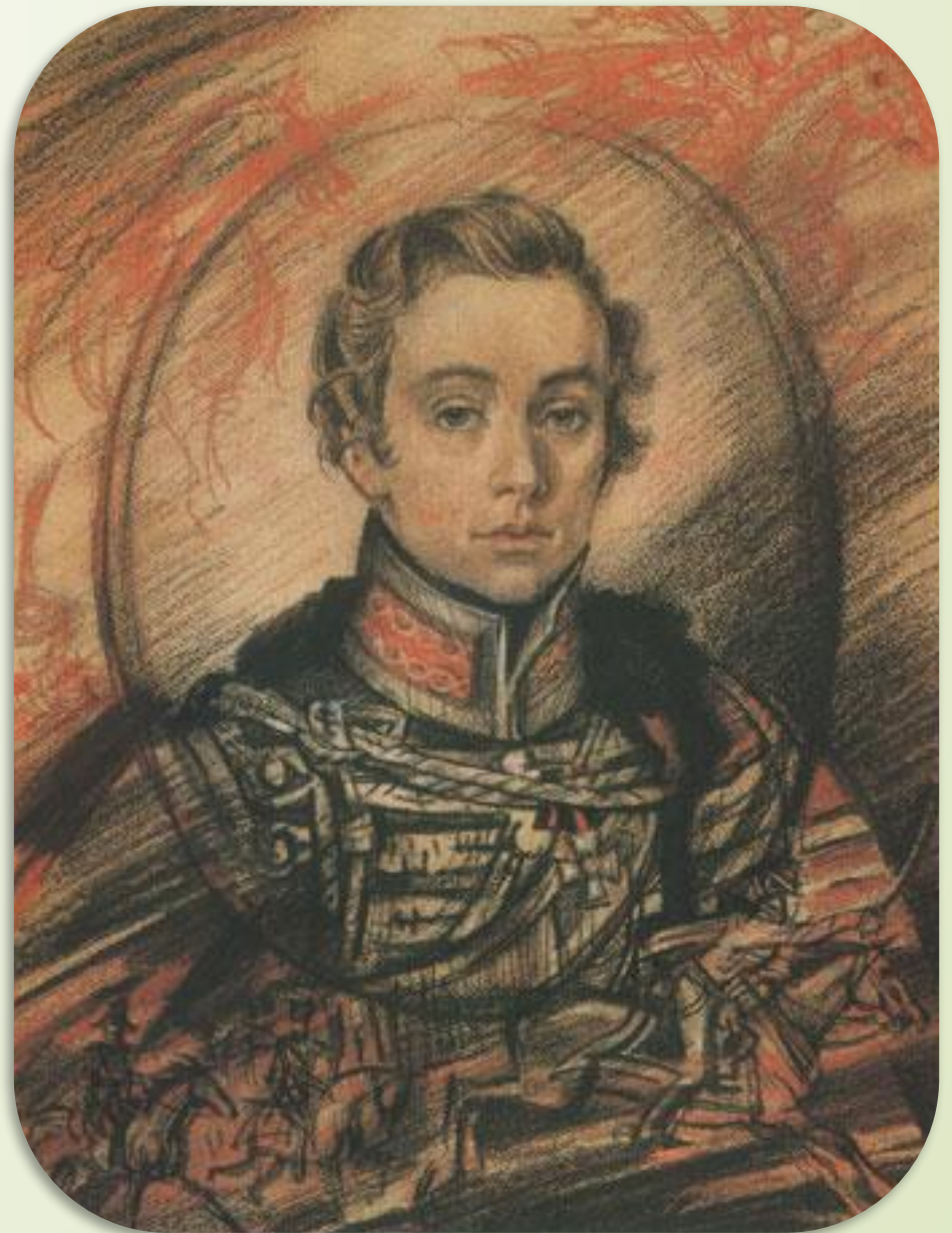
Надежда Андреевна Дурова