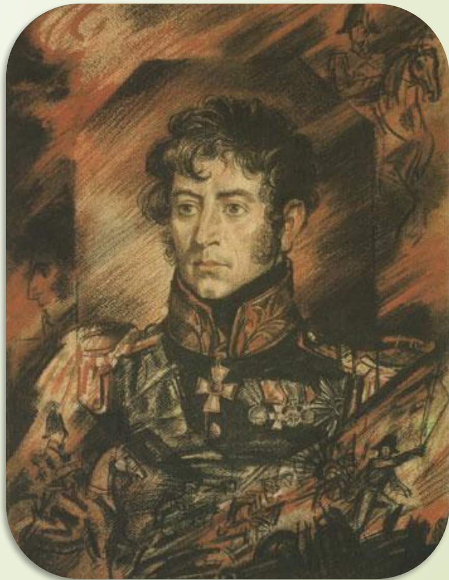
Михаил Андреевич Милорадович