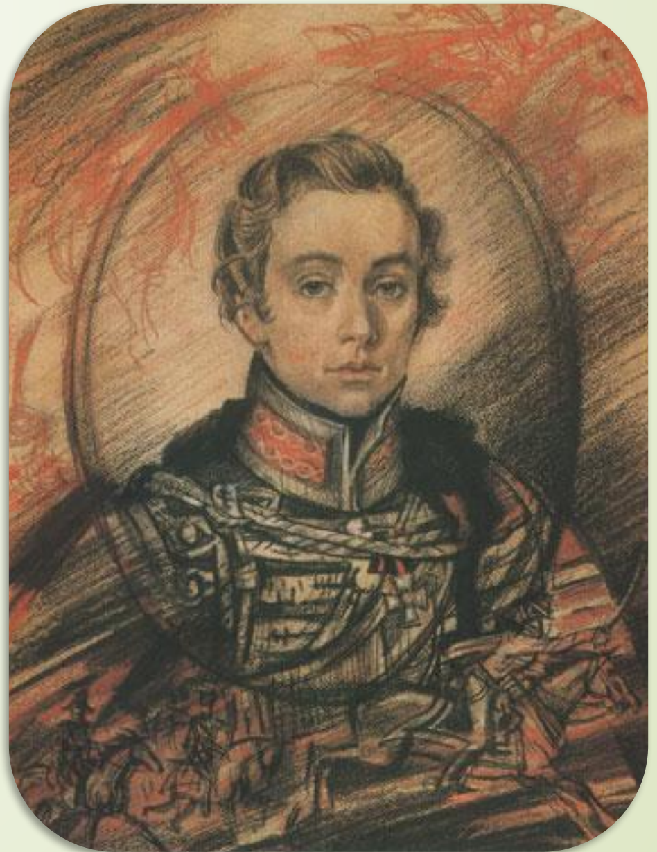
Надежда Андреевна Дурова