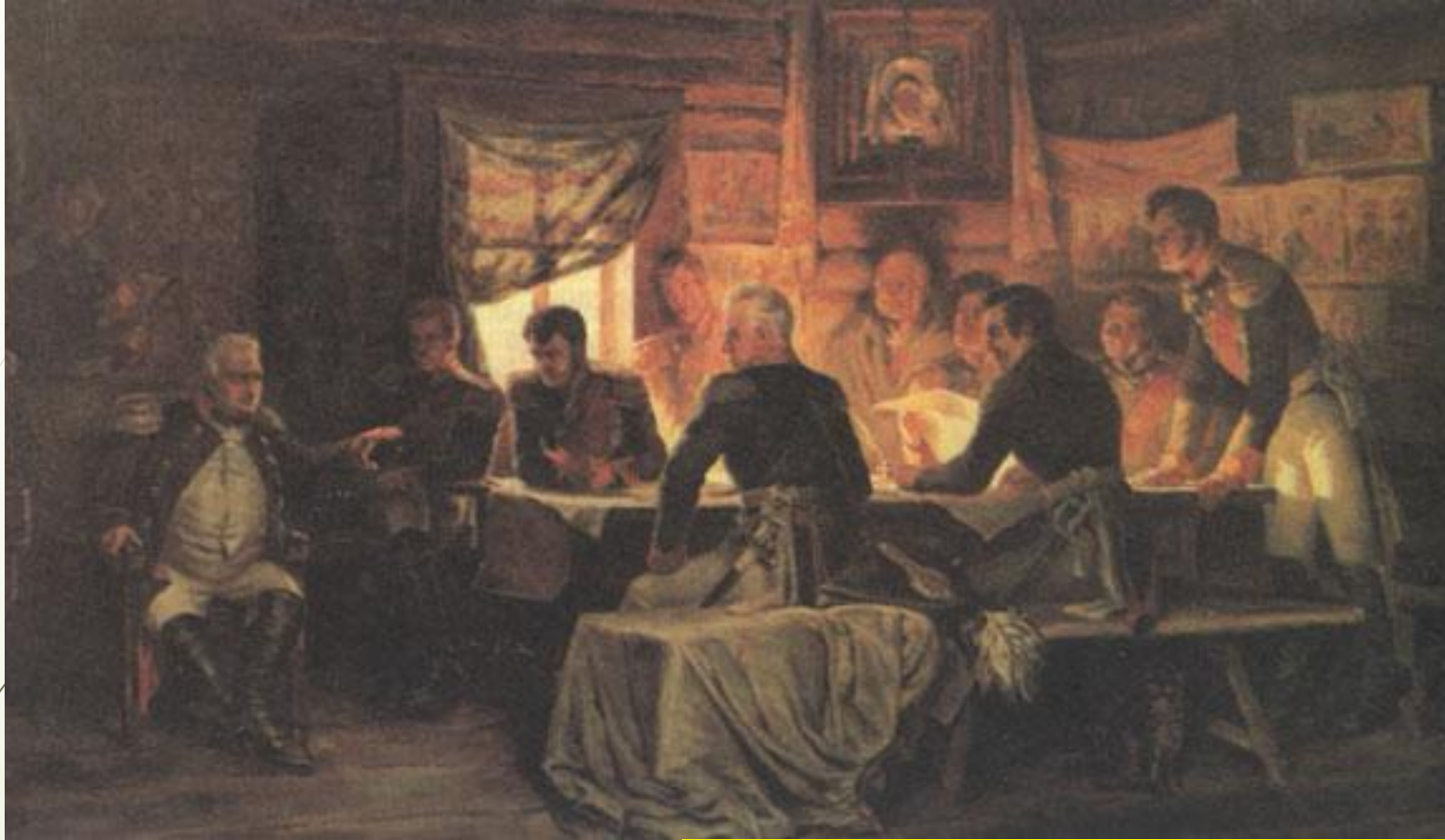
А. Кившенко. Военный совет в Филях

Русские войска отступали к Москве. Кутузов созывает в Филях военный совет и ставит вопрос: давать бой под Москвой или сдать древнюю столицу. Решающими стали слова Кутузова «Пока цела армия, цела и Россия». Было решено оставить Москву.