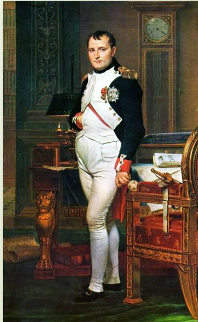
Ж.Л. Давид. Наполеон в своём кабинете.

12 июня 1812 года громадная французская армия вторглась в Россию. Началась Отечественная война русского народа против захватчиков.