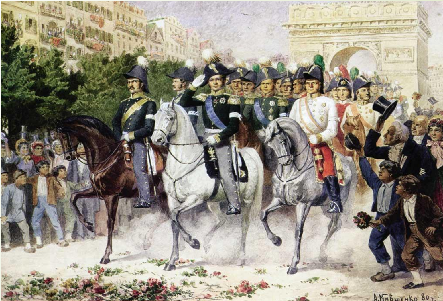
А. Кившенко. Вступление русских и союзных войск в Париж.

В 1814 году русские войска и их союзники вошли в Париж. Так закончилась попытка поставить Россию на колени.