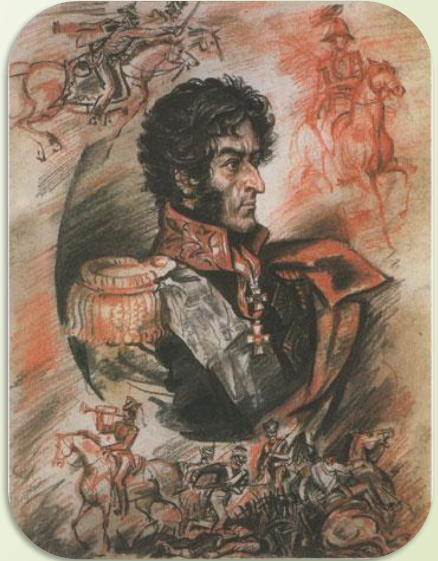
Пётр Иванович Багратион