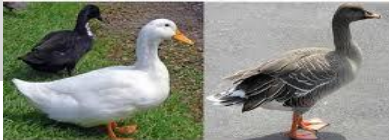
Это тоже домашние птицы – утки и гуси.