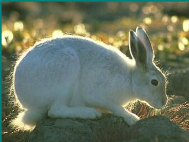
Заяц - беляк