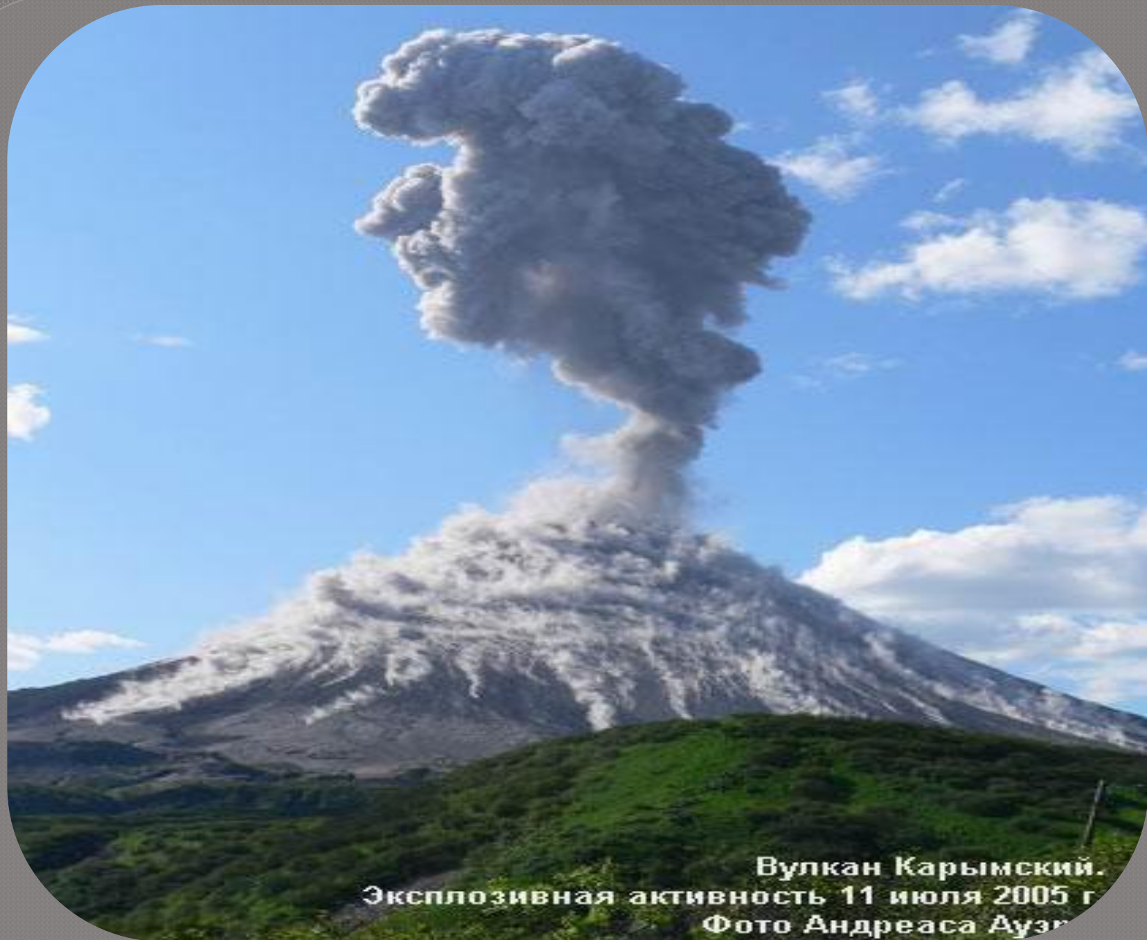
Вулкан Карымский. Эксплозивная активность 11 июля 2005 г.