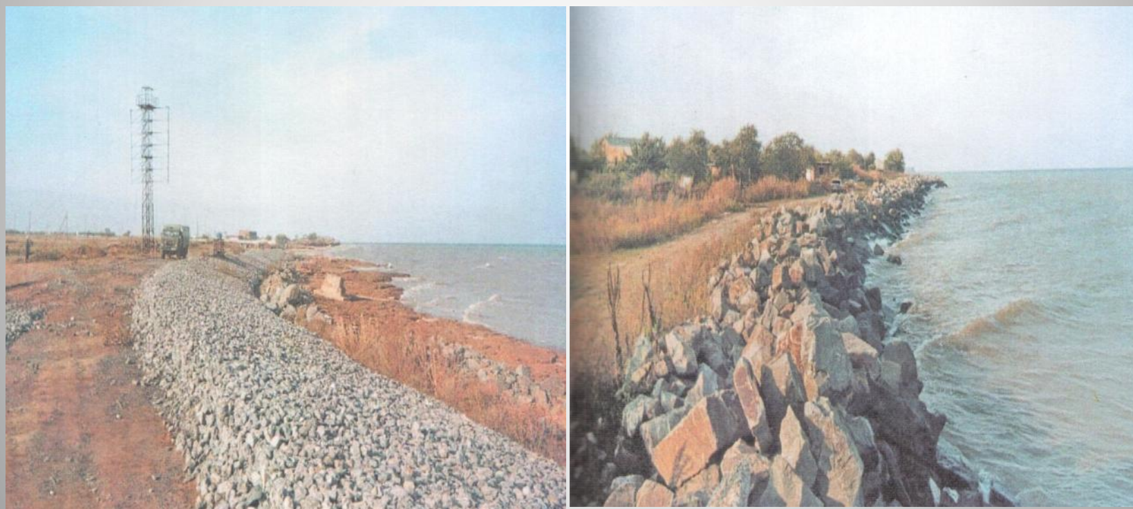
Берегозащитные сооружения на южном побережье Цимлянского водохранилища

В верхнем течении запрещено судоходство для тех видов водного транспорта, которые сильно разрушают берега.