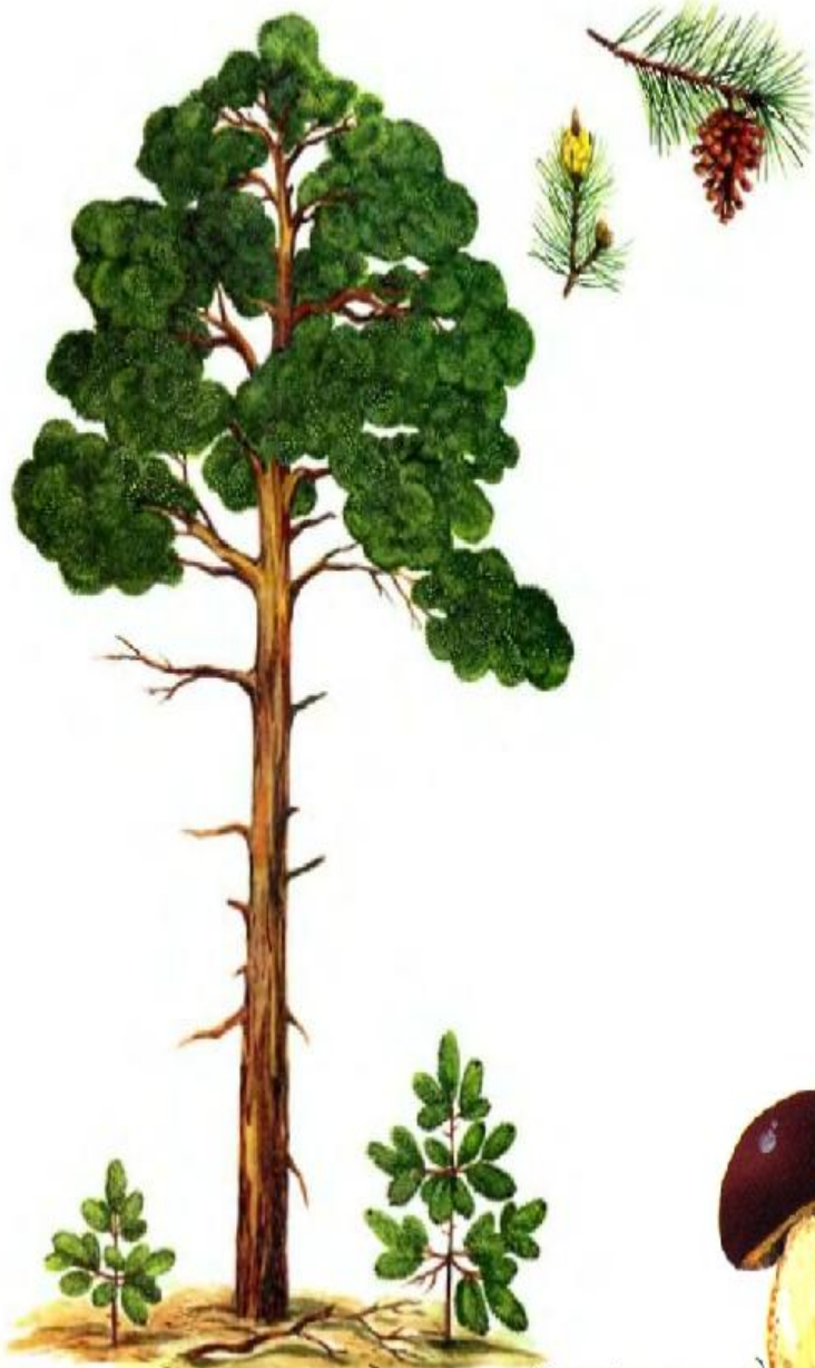
Сосна (лето, зима)