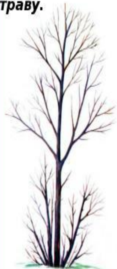
Ольха (осень)