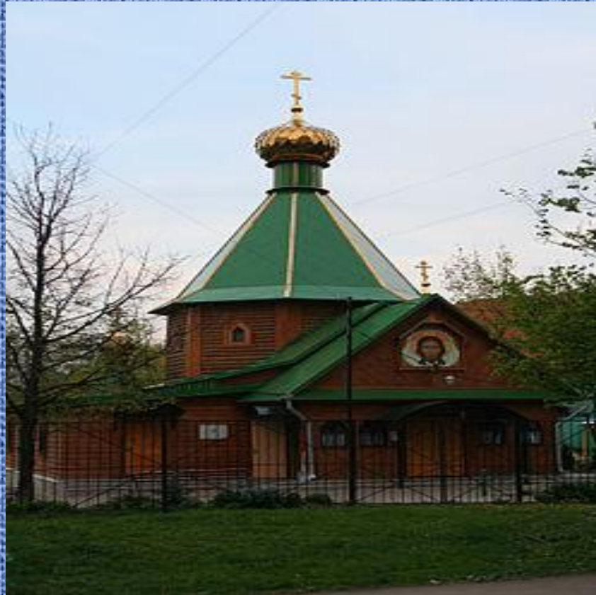
Церковь Живоначальной Троицы