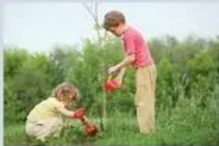
Ухаживать за растениями