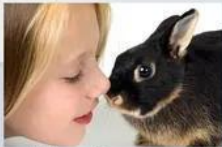
Любить и беречь животных