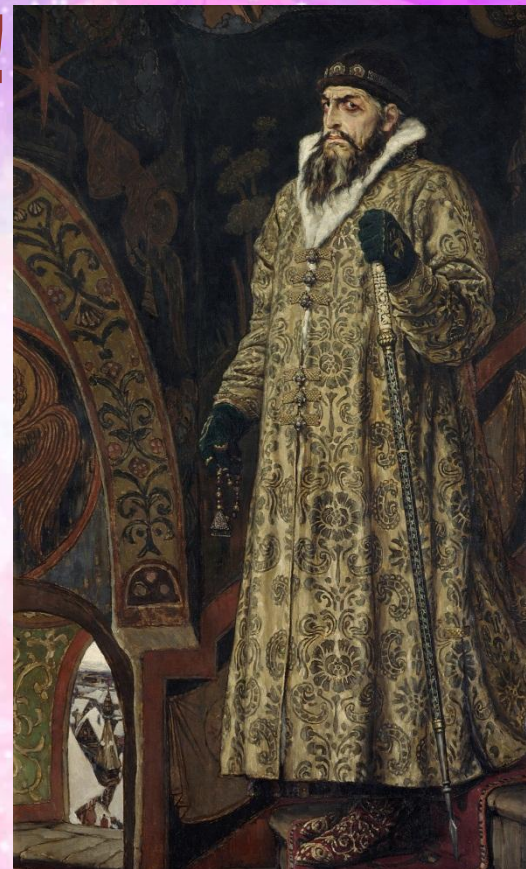
Васнецов В. Царь Иван Васильевич Грозный ГТГ

И если вы ответите на все мудрые вопросы, то мы сможем раскрасить прекрасный храм, который был построен по приказу русского царя Ивана Грозного в XVI веке.