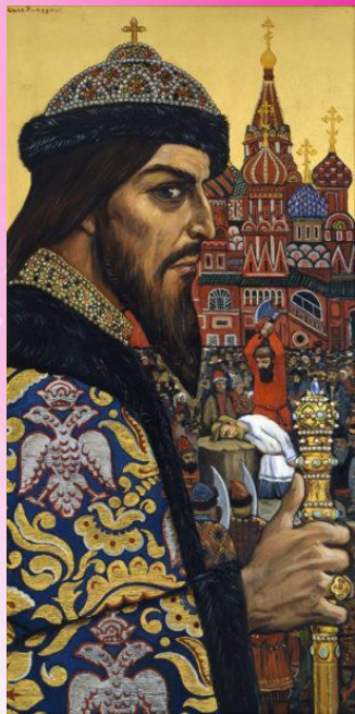
И. Глазунов «Иван IV Грозный»