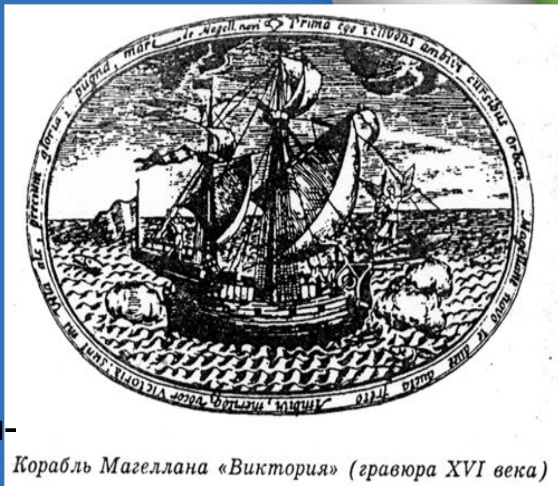
Корабль Магеллана «Виктория» (гравюра XVI века)

20 сентября 1519 года флотилия Магеллана выходит из порта Сан-Лукар. В экспедицию отправляются пять кораблей: «Виктория», «Тринидад», «Сантьяго», «Консепсьон», «Сан-Антонио», на них находится 265 человек экипажа.