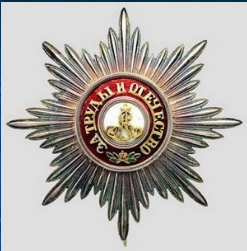
Орден Александра Невского 1724г.