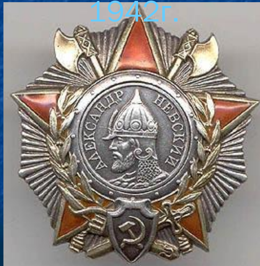
Орден Александра Невского 1942г.