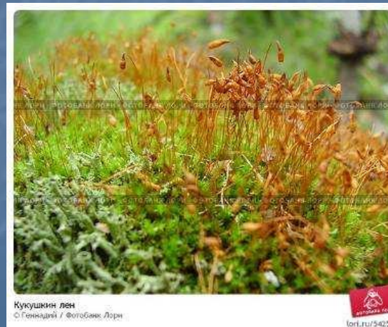
Кукушкин лен