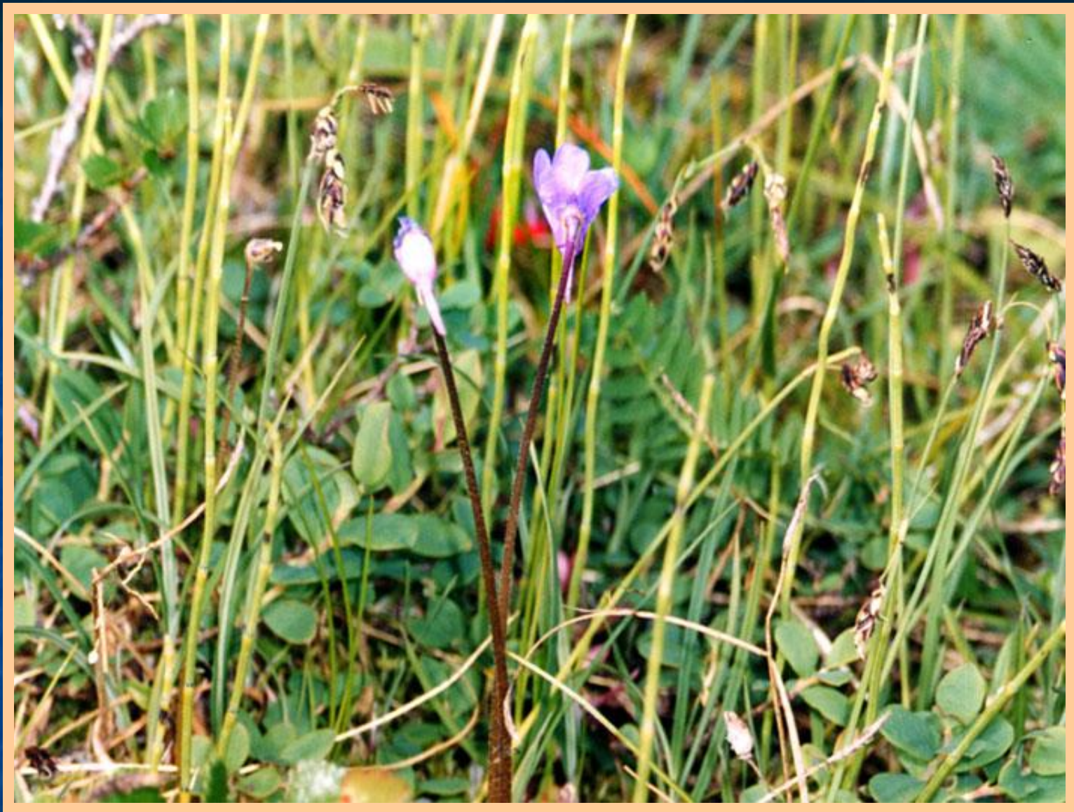
Насекомоядное растение в тундре — жирянка обыкновенная