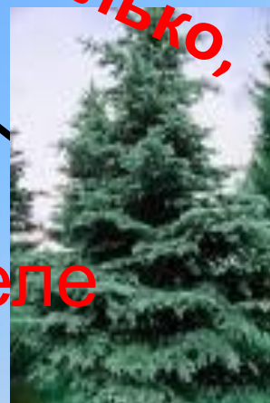
7 ел й