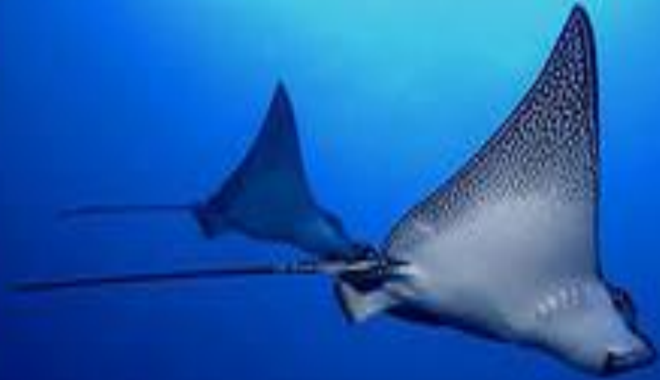
Stingray (Dasyatis sp.)