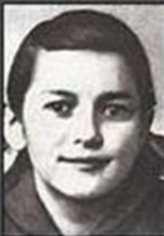
Зина Портнова, убила фашиста на допросе из его же пистолета. Была замучена пытками.