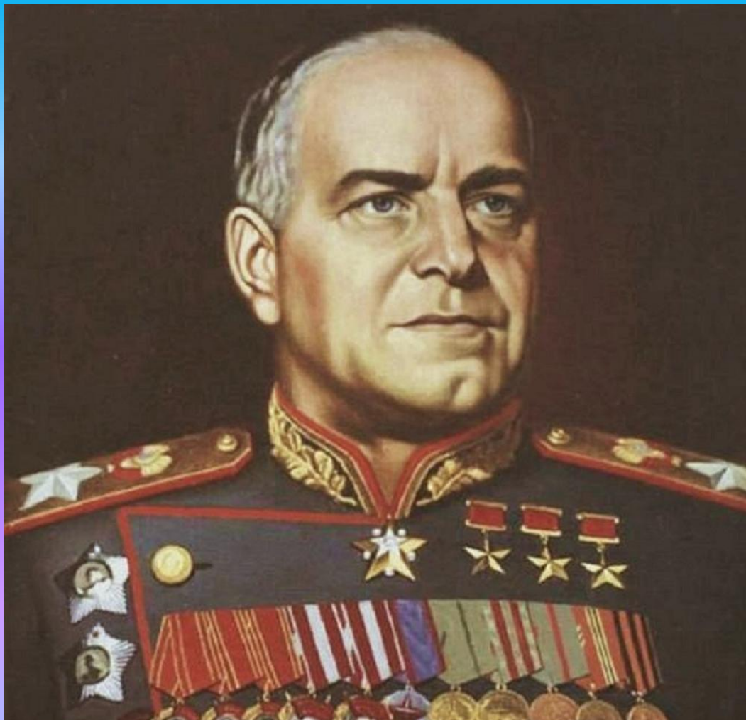
Георгий Константинович Жуков

Во главе армии всегда стоят главнокомандующие, они руководят всеми боями. В Москве в честь этого героя названа улица: проспект Маршала Жукова. А на Красной площади ему установлен памятник.