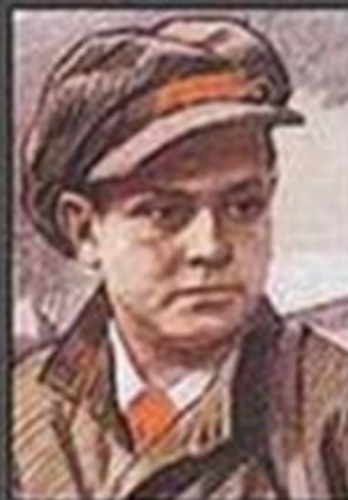
Лёня Голиков, партизан, убил фа- шистского генерала и добыл важные документы. Погиб в бою.