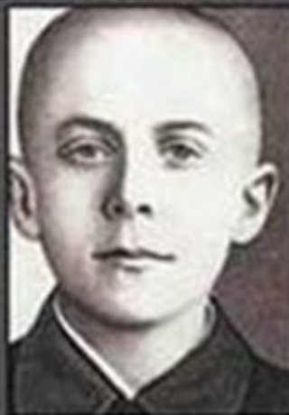
Марат Казей, юный разведчик из партизанского отряда, взорвал себя и окруживших его фашистов гранатой.