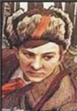
Валя Котик, 14-летний Герой Советского Союза (звание присвоено посмертно).