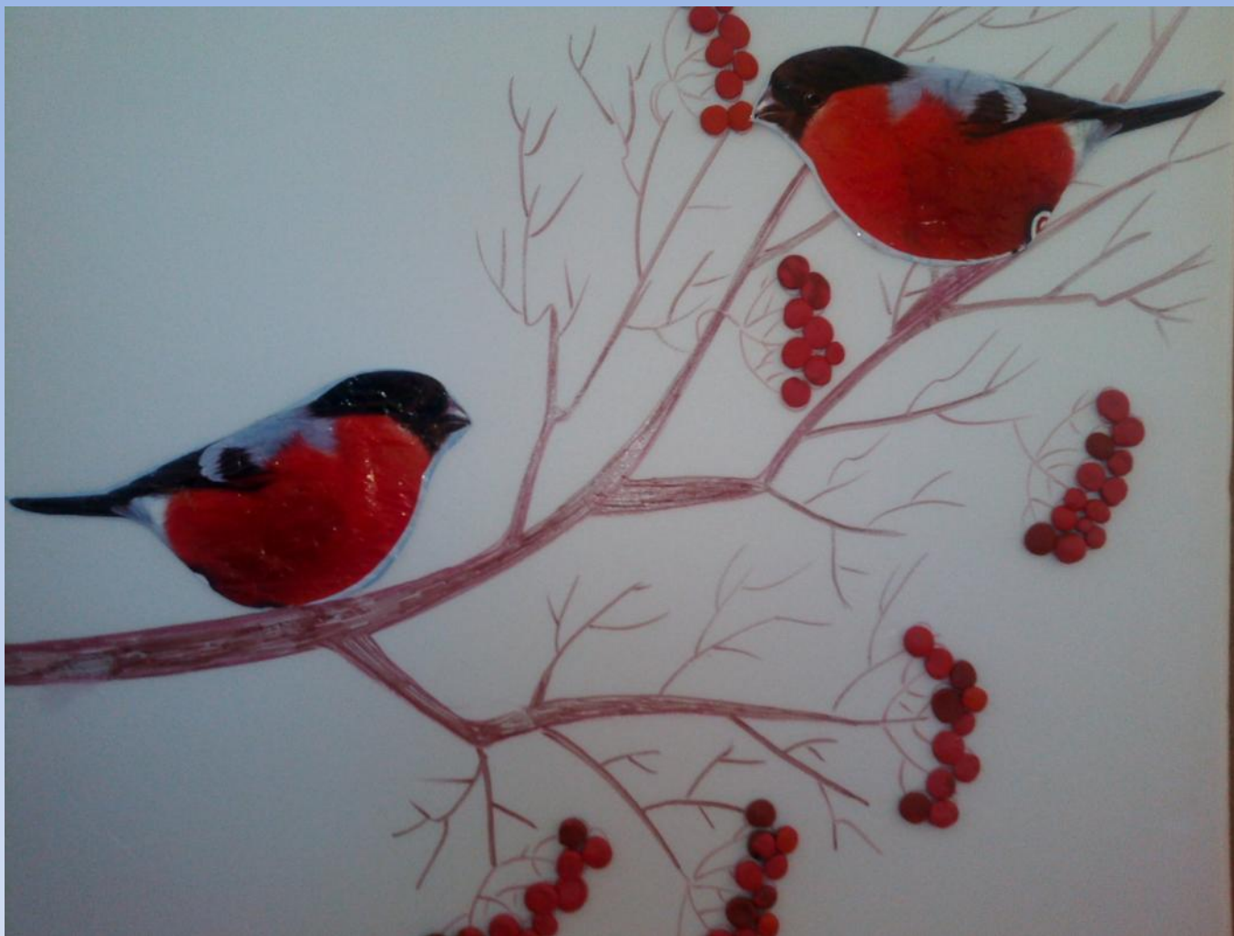
Коллективная работа по лепке «Ягоды для птички»