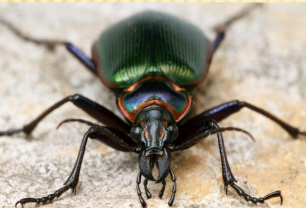
Жужелица поедает гусениц Бабочек