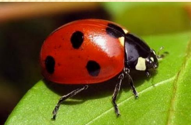
Божья коровка поедает тлей