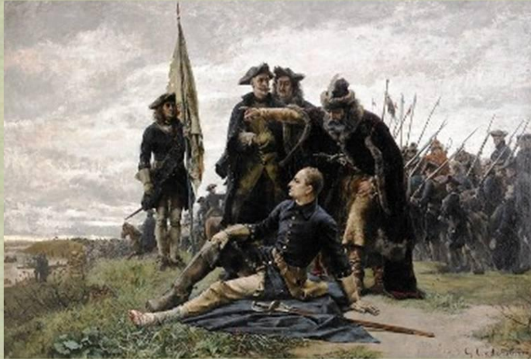
«Мазепа и Карл XII после Полтавской битвы». Седерстрём (1880).

Карл XII пытался воодушевить своих воинов и появился в месте самой горячей схватки. Но ядро разбило носилки короля, и тот упал. По рядам шведской армии с молниеносной быстротой пронеслась весть о гибели короля.