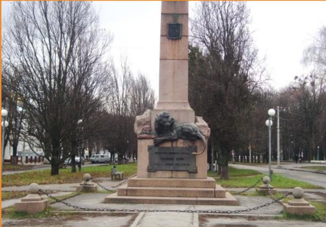
Памятник Келину А.С. В г. Полтава

Но все случилось иначе. Защитники крепости (4200 тыс. чел.). И местные жители. Имея всего 12 пушек, отчаянно держали осаду 3 месяца (20 штурмов). Руководил обороной крепости полковник Алексей Степанович Келин. При осаде крепости шведы потеряли 6 176 чел.