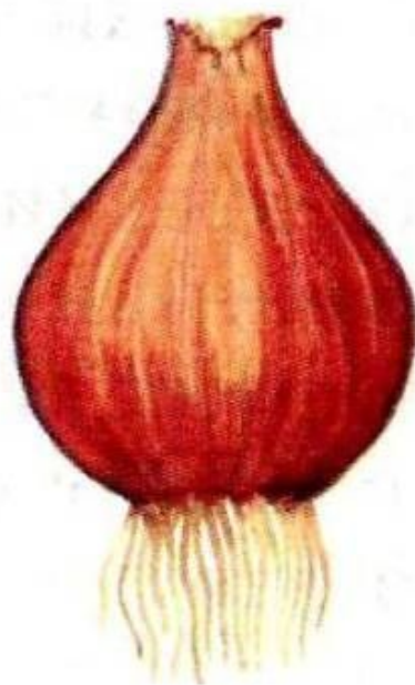
Внешний вид луковицы