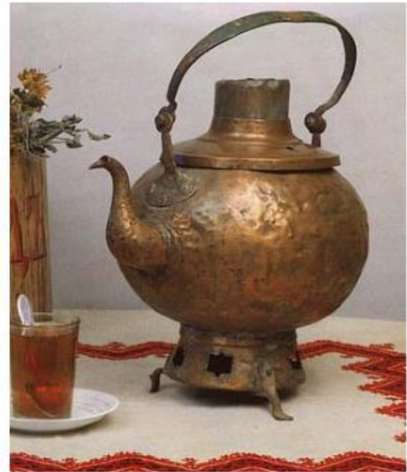
Чайник-самовар (сбитенник). Медь красная. Конец XVIII в.

Появился самовар не сразу. Его прадедушкой был сбитенник. Чай был конкурентом сбитня, любимого напитка Древней Руси. Этот горячий напиток приготавливался с медом и лекарственными травами в сбитеннике. Сбитенник внешне напоминает чайник, внутри которого помещалась труба для закладки угля.