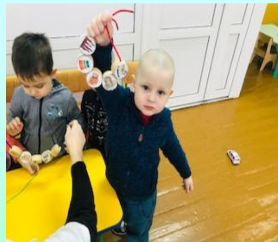
Дидактическое пособие «Собери бусы»