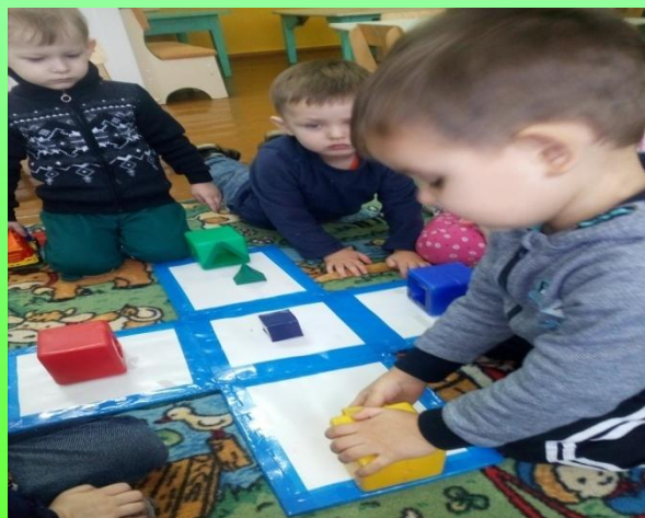
Дидактическое пособие «Где живут фигуры?»