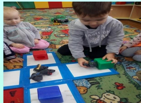
Дидактическое пособие «Найди домик мышке»