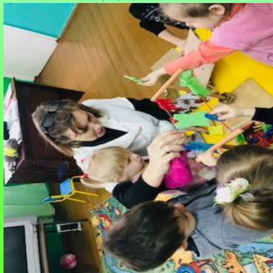
Дидактическое пособие «Развесь одежду»