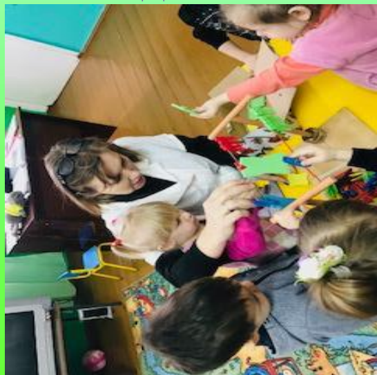
Дидактическое пособие «Развесь одежду»