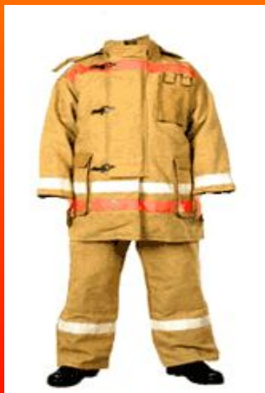
Боевая одежда пожарного