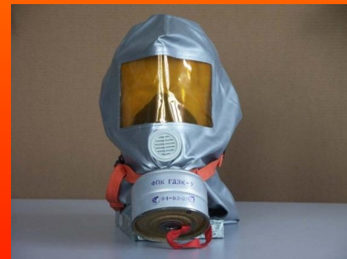
Маска - противогаз