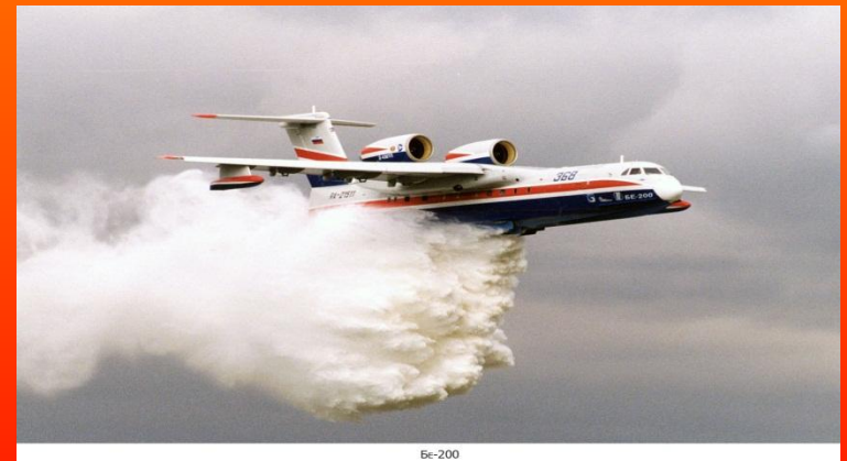
Самолет для тушения пожаров в лесу