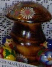
ПОЛХОВ-МАЙДАНСКАЯ ИГРУШКА (САРАРУШКА)