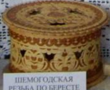
ШЕМОГОДСКАЯ РЕЗЬБА ПО БЕРЕСТЕ