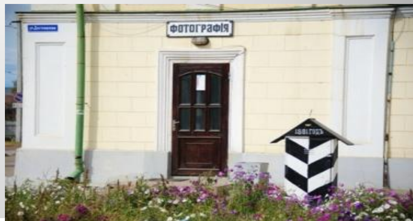
Бутинский дворец в г Нерчинске