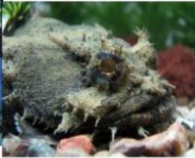
Рыба - жаба