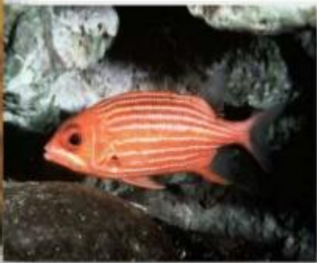
Рыба - белка