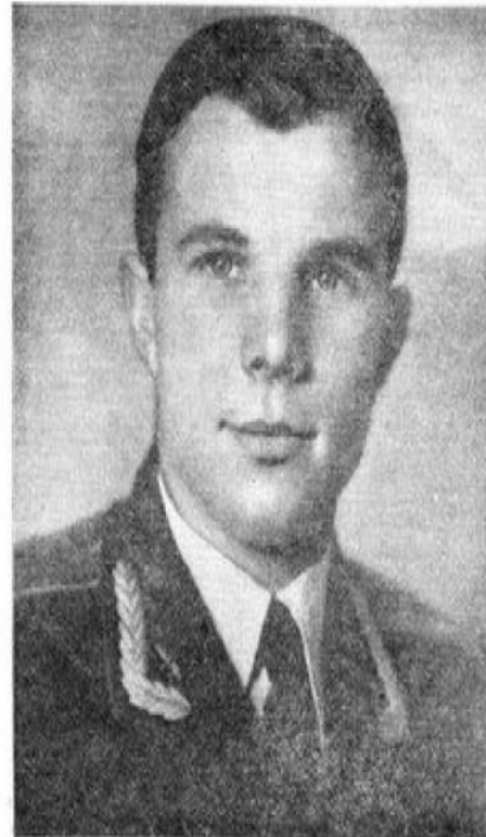
ЮРИ АЛЕКСАНДРОВИЧ ГАГАРИН

КАПИТАН ПЕРВОГО ЗВЕЗДОЛЕТА—НАШ, СОВЕТСКИЙ!