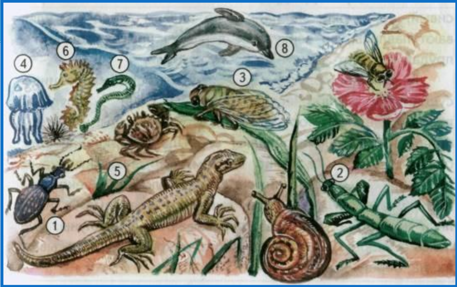
1-кавказ бызылдавыгы, 2-суфи чикерткәсе, 3-цикада, 4-медуза, 5-краб, 6-диңгез атчыклары, 7-диңгез энәләре, 8-дильфиннар