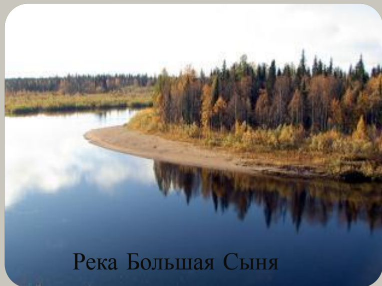
Река Большая Сыня