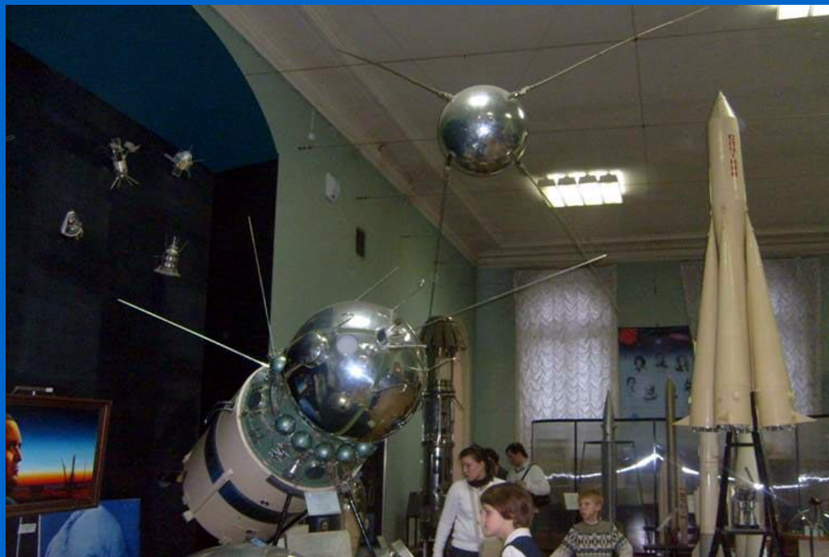
Спутники и корабли