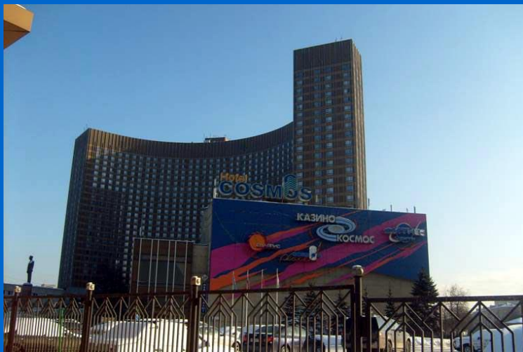
Москва. Гостиница «Космос»