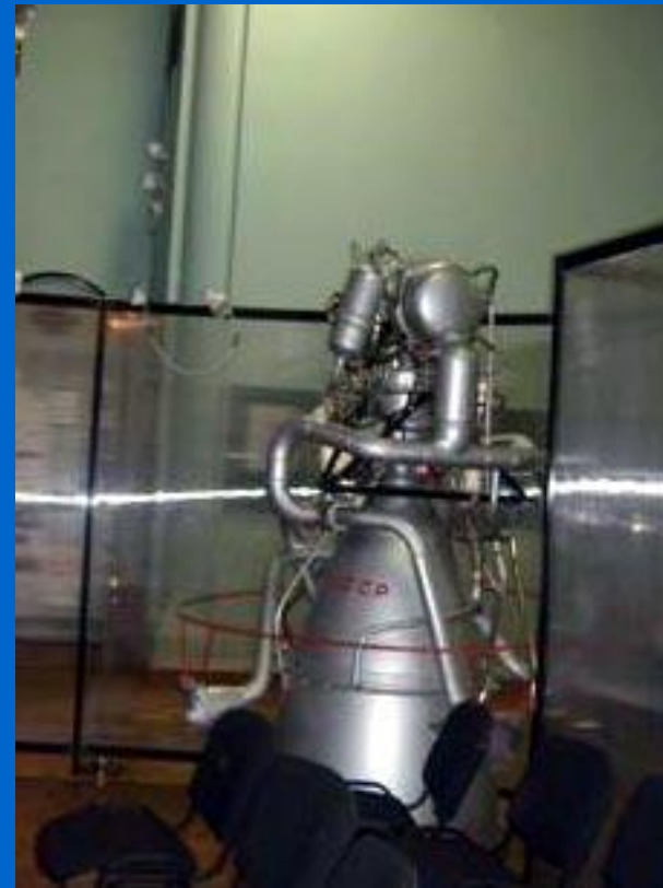
Двигатель космического корабля по проекту Глушко