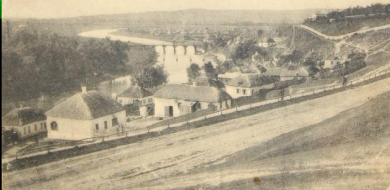
Валу́йки.—Valouïky. № 2.