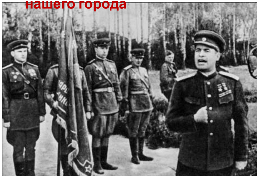
Дважды Герой Советского Союза Черняховский И. Д.

Их знают и помнят воронежцы. Их именами названы улицы нашего города