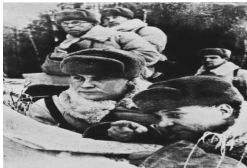
Генерал – майор А.И. Лизюков ( фронтовое фото)