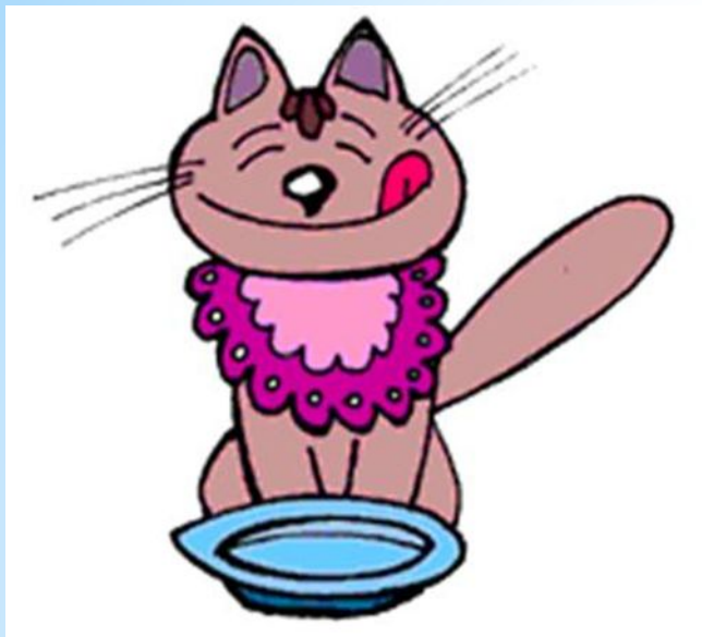
Лепка «Мисочка для кошечек».