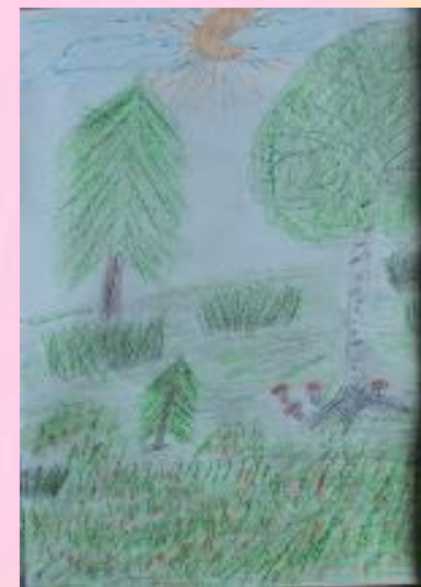
О цветах о животных