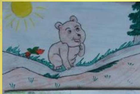
У Миши с в гостях