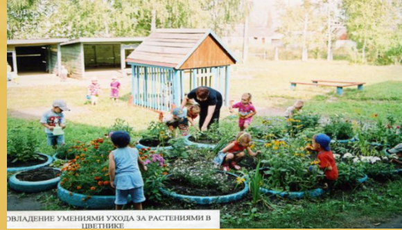
ОВЛАДЕНИЕ УМЕНИЯМИ УХОДА ЗА РАСТЕНИЯМИ В ЦВЕТНИКЕ

Цель: закрепить знания детей о цветочных растениях, правилах посадки и ухода за ними, обучать правилам дизайна цветников, развивать творчество, фантазию детей