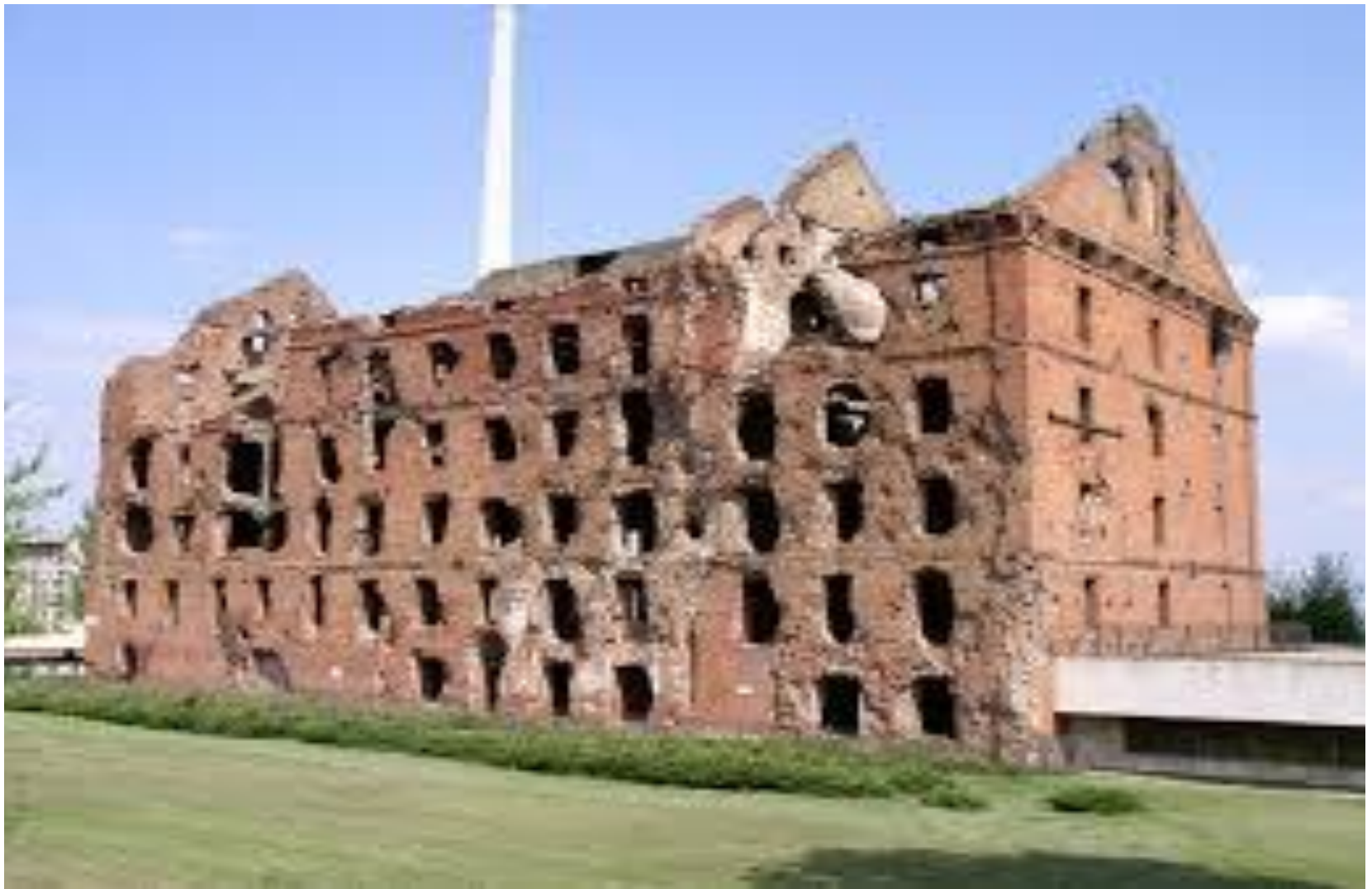
Здание бывшей мельницы.