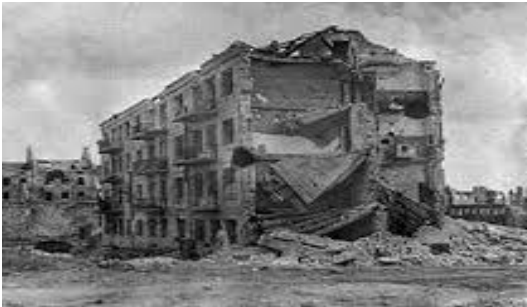
Разрушенный город- после войны