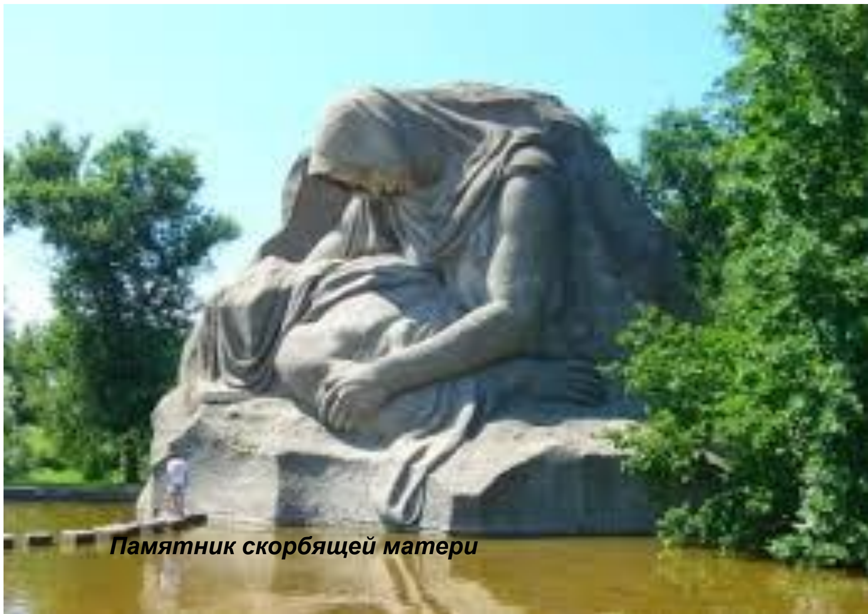
Памятник скорбящей матери