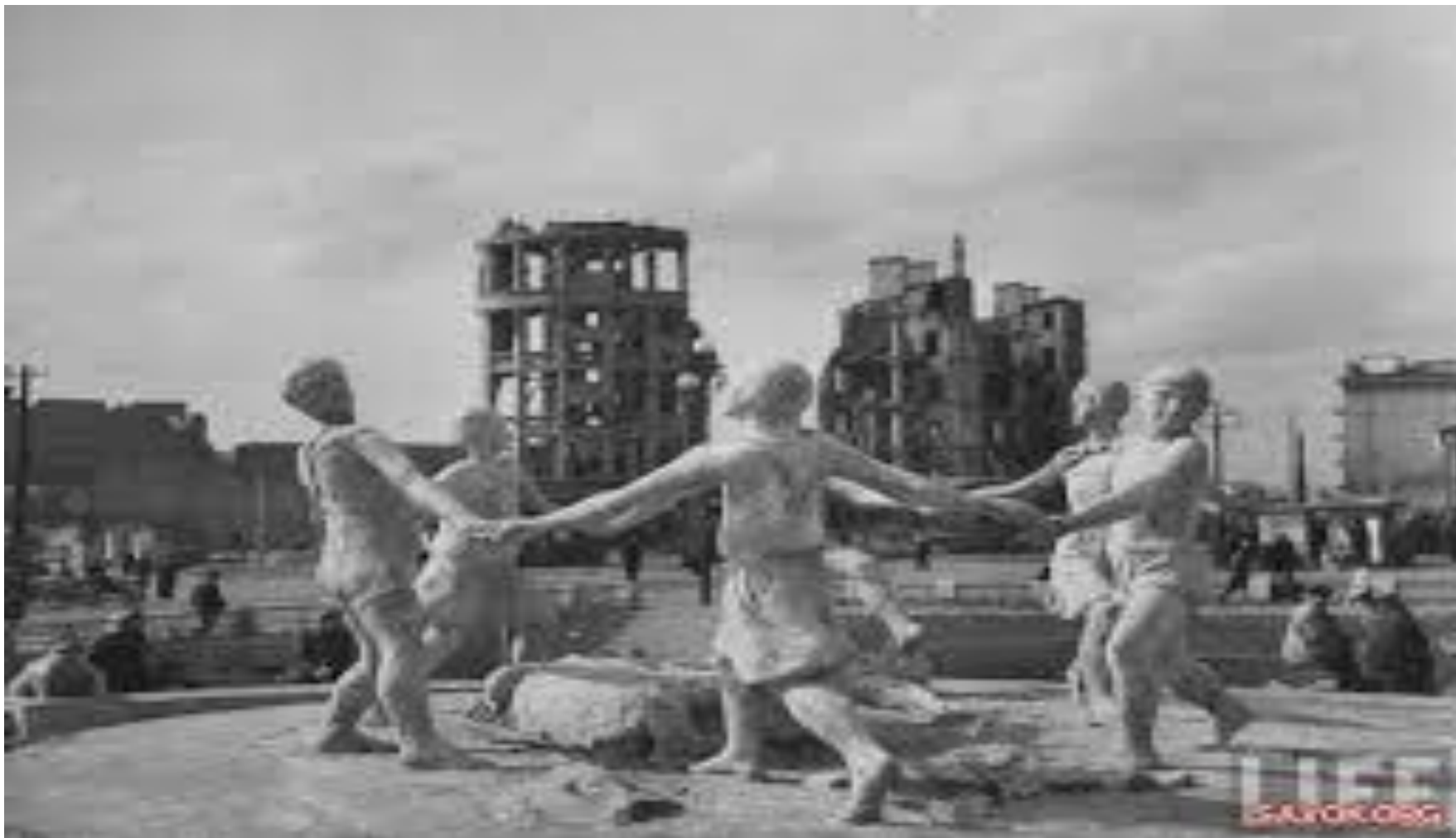
Сталинград – город войны