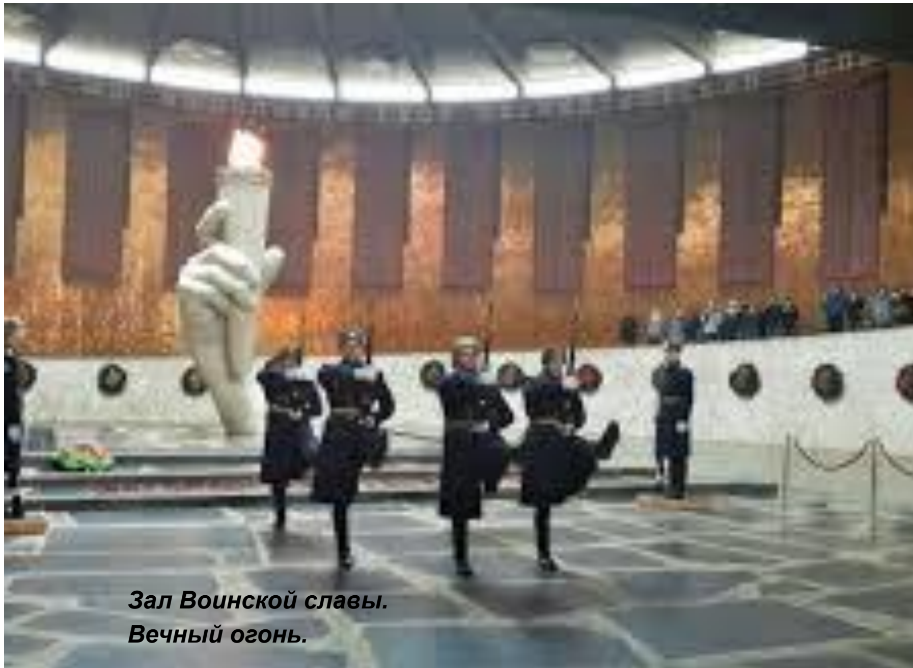
Зал Воинской славы. Вечный огонь.